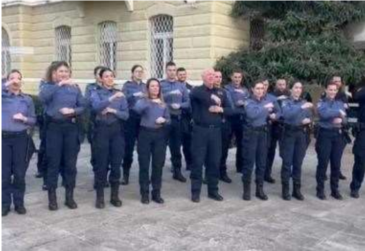
VIDEO: Dubrovačka policija čestitala Božić i Novu godinu na znakovnom jeziku