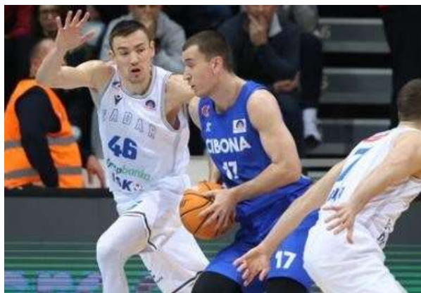
Izvan svake logike: Okrnjena Cibona šokirala na Višnjiku Zadrane