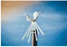
Litanije Duhu Svetom