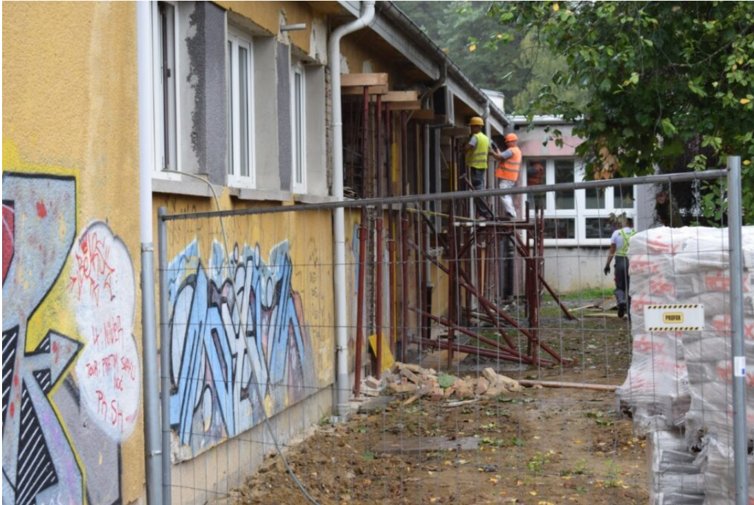
radovi srednja skola viktorovac

U tijeku su i radovi obnove na sjevernom dijelu Srednje škole Viktorovac vrijedni 2,2 milijuna kuna, a ova javna nabava imala je, posredno, utjecaja i na nekoliko drugih, te poništavanje, za sada, jednog natječaja obnove kojeg je Županija raspisala.