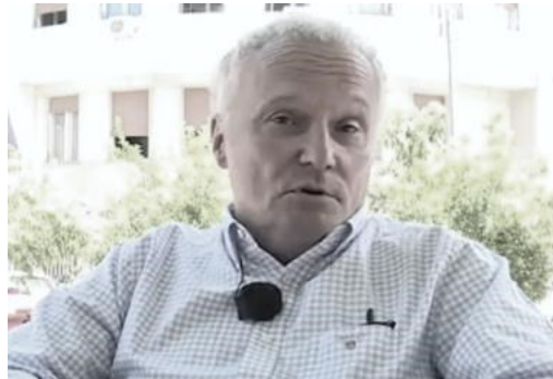
SRPSKI MEDIJI: Poznatog novinara nasmrtno izgrizli psi