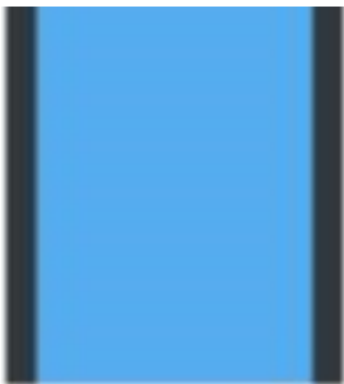
Potres 3,5 prema Richteru pogodio okolice Osijeka