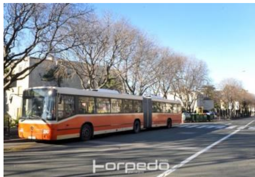
KD Autotrolej počinje prodavati karte u autobusima