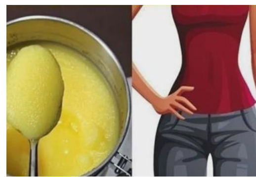
Šok! Pila je 1 žličicu dnevno i smršavjela 52 kg