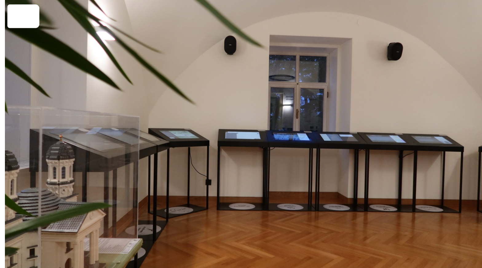
Dvorac Janković u Suhopolju, prikaz interaktivnih ruta

U drugom primjeru, obnova dvorca Trenkovo u Požeško-slavonskoj županiji u samom je začetku. Odobrena su EU sredstva za izradu projektne dokumentacije za obnovu čime bi on postao posjetiteljski centar posvećen barunu Trenku i nova kulturno-turistička destinacija Požeško-slavonske županije te cijele Slavonije, dostupna turistima i široj javnosti. Posjetiteljski centar će objedinjavati kulturne, turističke, prirodne, materijalne i nematerijalne znamenitosti i baštinu bogatih povijesnih zbiljanja i prilika ovog kraja i Trenkovog života.