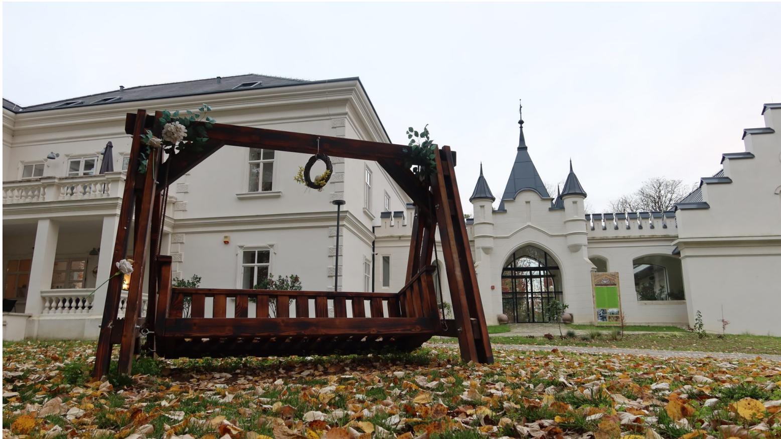
Dvorac Janković u Suhopolju

hotelsko-ugostiteljske ponude, suvenirnice, ulaznice za park prirode ili organizacije povijesno-zabavnih manifestacija.