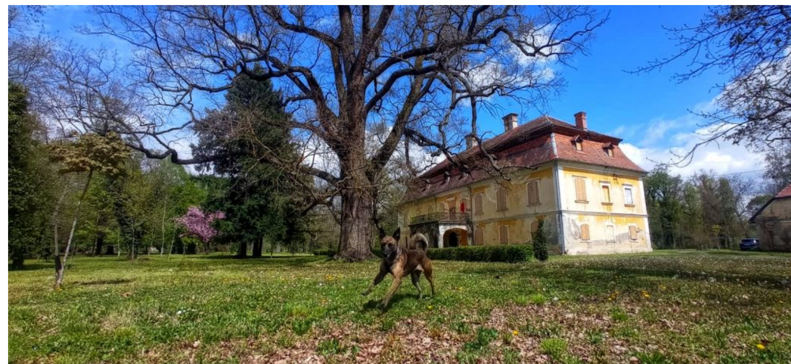
Dvorac Trenkovo, općina Velika

U drugom primjeru, obnova dvorca Trenkovo u Požeško-slavonskoj županiji u samom je začetku. Odobrena su EU sredstva za izradu projektne dokumentacije za obnovu čime bi on postao posjetiteljski centar posvećen barunu Trenku i nova kulturno-turistička destinacija Požeško-slavonske županije te cijele Slavonije, dostupna turistima i široj javnosti. Posjetiteljski centar će objedinjavati kulturne, turističke, prirodne, materijalne i nematerijalne znamenitosti i baštinu bogatih povijesnih zbiljanja i prilika ovog kraja i Trenkovog života.