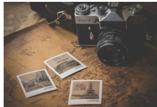
Fotoklub Rijeka poziva na međunarodni fotografski natječaj