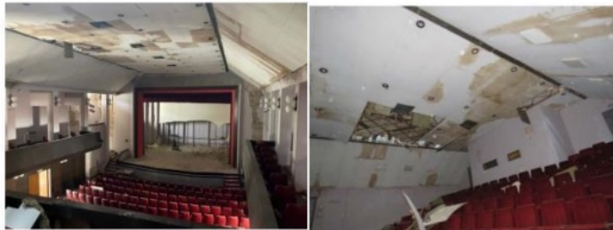
ZATEČENO STANJE NA DAN 1.9.2022.

No, ono što je jasno iz dokumentacije je kako je stanje objekta, zbog izloženosti dvije godine atmosferilijama te zbog nezaštićene krovne konstrukcije puno gore nego je opisano u elaboratu zatečenog stanja koji je bio priložen javnom natječaju. To se vidi i iz jedne od primjedbi potencijalnih ponuđača u dokumentaciji.