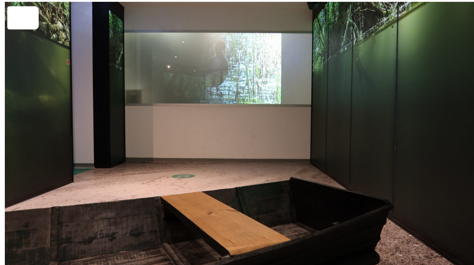
Prezentacijsko – edukacijski centar Tikveš

Dvorac Gređice u Zagorju danas poznatiji kao dvorac Gjaski jest heritage hotel s četiri zvjezdice u sklopu kojega su restoran te vinoteka u podrumu dvorca koja se lako može prenamijeniti u svrhu organizacije poslovnih konferencija, team buildinga i raznih drugih proslava, kapaciteta do 140 ljudi. Ovaj dvorac je u potpunosti rekonstruiran privatnim sredstvima još 2006. godine, a dodatno obnovljen 2019. godine nakon što je promijenio vlasnika. Iako je novi vlasnik nastavio s radom hotela i restorana, odlučio ih je učiniti pristupačnijima lokalnom stanovništvu nešto nižim cijenama u odnosu na prijašnje prilike. Danas je ovaj hotel ugodno popunjen te nudi mogućnost organizacije raznih događanja, uključujući i svadbene svečanosti.