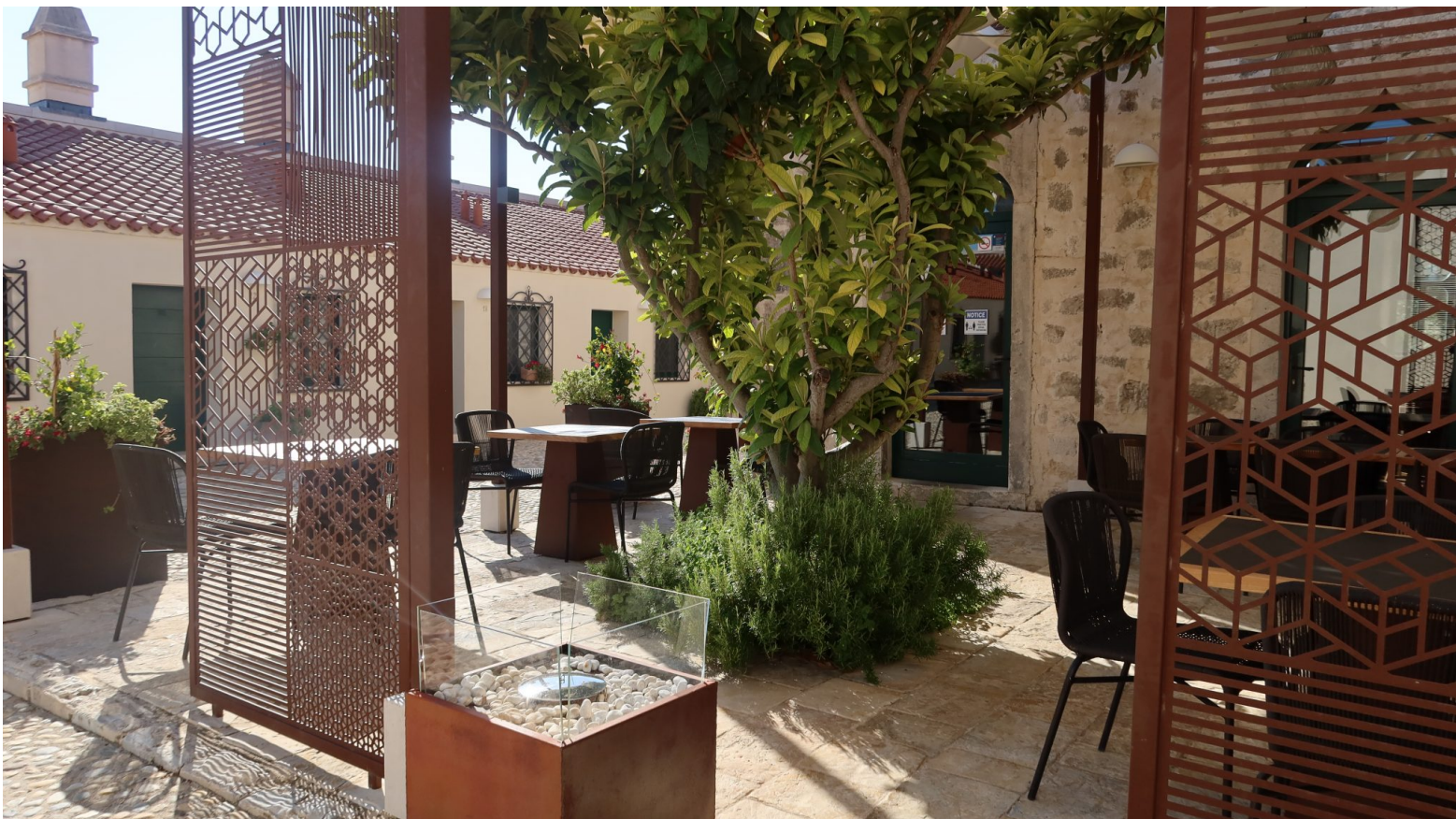
Maškovića Han

“Rezultat je višenamjenski kompleks s hotelskim smještajem od četiri zvjezdice, restoranom, turističkim info punktom, izložbenim prostorom i prodajnim mjestima za autohtone proizvode. Otvorena su nova radna mjesta, poboljšana turistička i kulturna ponuda te stvoreni preduvjeti za gospodarski razvoj mjesta Vrane i općine Pakoštane”, navodi se na službenoj web stranici Maškovića hana.