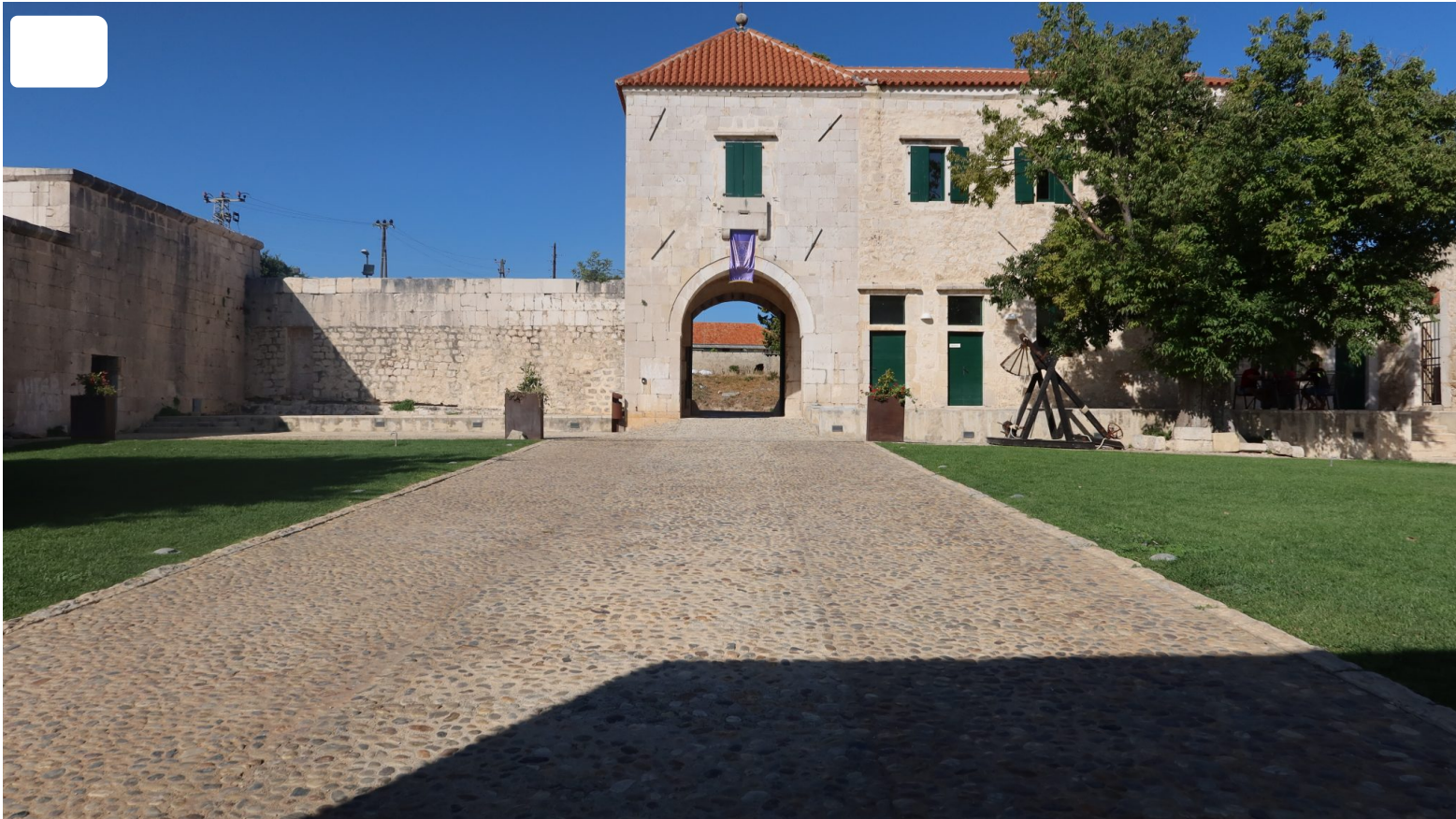
Maškovića Han

“Rezultat je višenamjenski kompleks s hotelskim smještajem od četiri zvjezdice, restoranom, turističkim info punktom, izložbenim prostorom i prodajnim mjestima za autohtone proizvode. Otvorena su nova radna mjesta, poboljšana turistička i kulturna ponuda te stvoreni preduvjeti za gospodarski razvoj mjesta Vrane i općine Pakoštane”, navodi se na službenoj web stranici Maškovića hana.