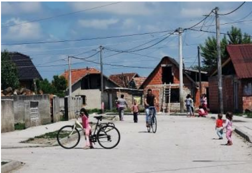
„NJIHOVI I NAŠI“: Začarani krug najvećeg geta u Hrvatskoj