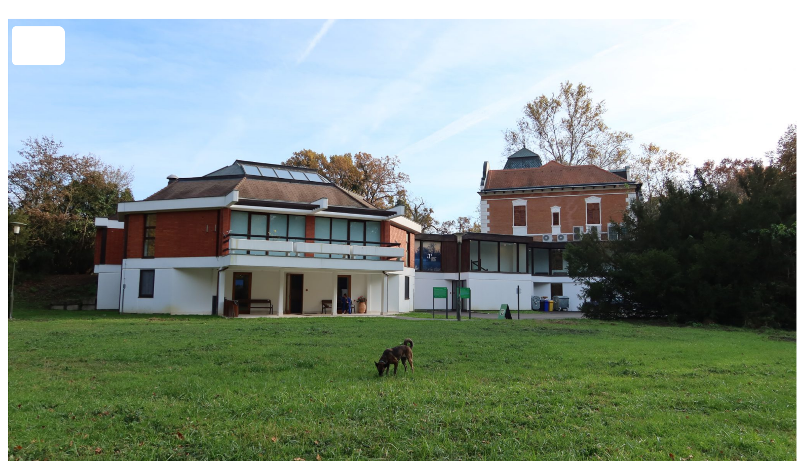
Prezentacijsko – edukacijski centar Tikveš

U aneksu Novog dvorca koji je prenamijenjen u centar za interpretaciju prirode jest interaktivna audio-vizualna prezentacija smjene godišnjih doba u parku prirode Kopački rit. Impresivan je to i skladno složen, detaljno razrađen stalni muzejski postav u kojem su korištena suvremena tehnološka rješenja za prikaz flore i faune Kopačkog rita, poput 3D animacija i fotografija, 3D mapiranja, holograma, računalno isprogramiranih kvizova i zadataka. Ovako je izgledno da će postav izložbe biti zanimljiv mlađoj, tehnološki potkovanj publici, ali i starijim generacijama koje kroz nove tehnologije uče o povijesnoj i prirodnoj baštini ovoga kraj.