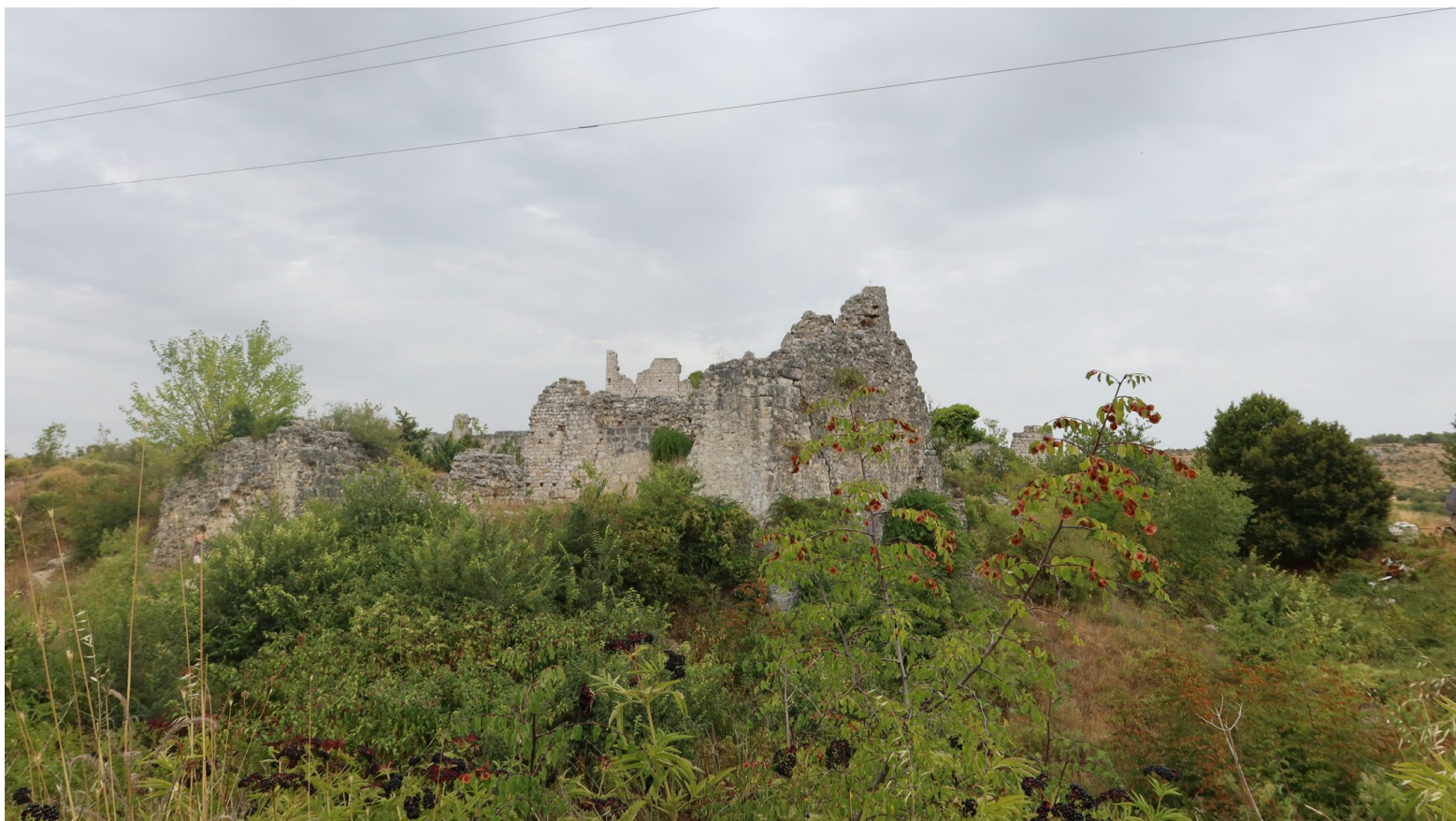
Utvrda Vrana

Udruga "Vranski vitezovi" od 2006. godine upriličuje manifestaciju "Dani vitezova vranskih" na lokalitetu u neposrednoj blizini utvrde Vrana, nedaleko od Hana Jusufpaše Maškovića. Sudjeluju na raznim manifestacijama oživljene povijesti diljem zemlje i inozemstva i doprinose očuvanju povijesne važnosti Vrane. Kako se manifestacija održava u jeku turističke sezone privlači i mnogobrojne turiste koji imaju priliku doživjeti djelić hrvatske povijesti kroz igrokaze, srednjovjekovne tabore i sajam, viteške turnire, stare zanate i vještine te jela i pića nastala prema originalnoj srednjovjekovnoj recepturi.