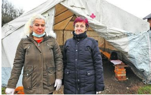
'Žena mi je dala konzervu pa me počela slikati kako jedem... Rekla mi je zašto i šokirala me'