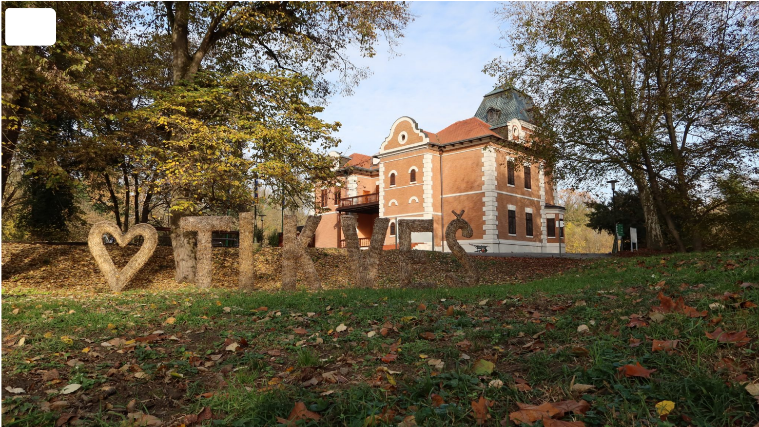
Dvorac Tikveš

TIKfest je ujedno bio prilika da svoja vrata otvori novoobnovljeni kompleks dvorca Tikveš. Projektom "Prezentacijsko edukacijski centar Tikveš", dvorac teško oštećen u Domovinskom ratu je obnovljen, i prenamijenjen u prezentacijsko-edukacijski centar s jedinstveno oblikovanim postavom kao ishodištem edukacije o prirodnim značajkama Kopačkoga rita i važnosti njegova očuvanja. I ovaj je projekt bio sufinanciran sredstvima Europske unije, ovog puta iz Europskog fonda za regionalni razvoj u okviru Operativnog programa „Konkurentnost i kohezija“.