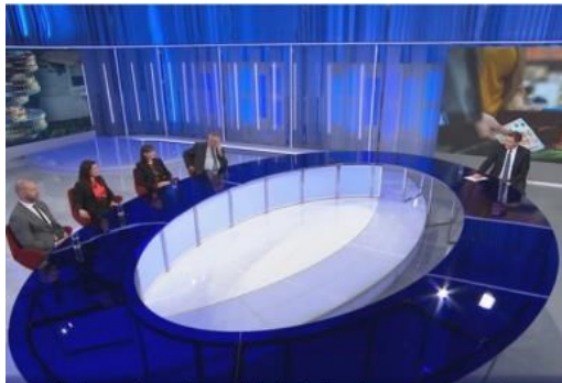
RASPRAVA U OTVORENOM: Zašto Plenkovićeve Vlada nije pripremila "stup srama" za gulikože