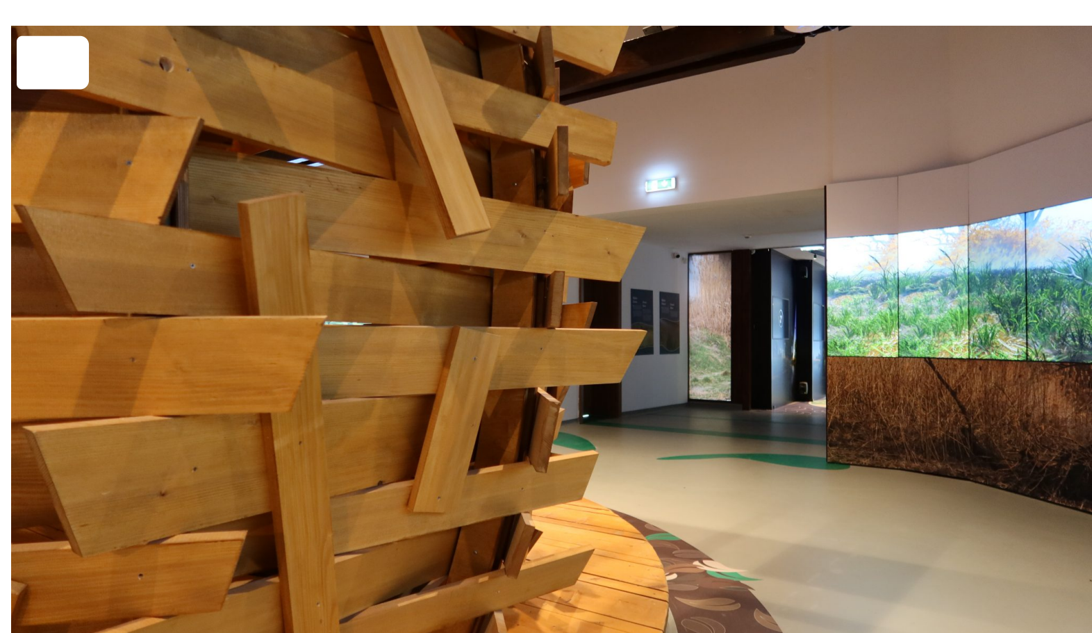
Prezentacijsko – edukacijski centar Tikveš

Uprava parka prirode kroz brojne projekte planira obnoviti i u funkciju staviti druge objekte unutar kompleksa, a kako bi se proširio turistički kapacitet lokacije i iskoristio puni potencijal samoodrživosti koju je ovdje sasvim sigurno moguće ostvariti u dogledno vrijeme.