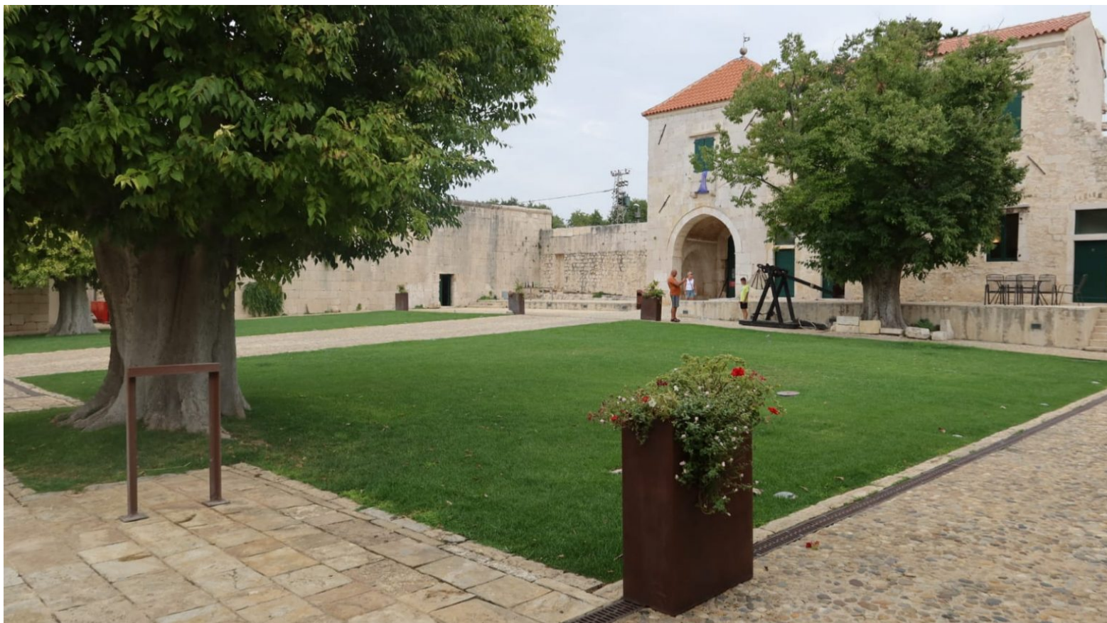
Maškovića Han

Izgradnja hana je započela 1644. godine. Međutim, samo godinu kasnije Mašković je smaknut na dvoru turskog sultana jer je ukazao milost mletačkim vojnicima i građanima po osvajanju Krete što se kosilo s krvožednim načinom osvajanja tadašnjeg sultana. Slijedom tragičnih događanja, han je završen, ali u mnogo skromnijem obliku nego je planirano.