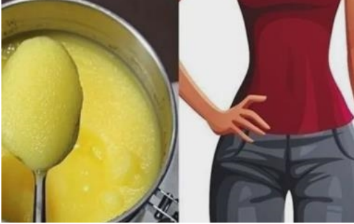
Šok! Pila je 1 žličicu dnevno i smršavjela 52 kg