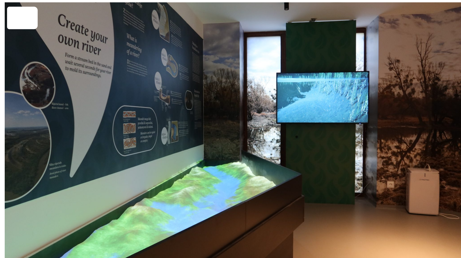
Dvorac Tikveš

U interaktivnoj šetnji kompleksom dvorca Tikveš može se saznati o povijesti kompleksa, njegovim vlasnicima i povijesno-geopolitičkim prilikama lokaliteta. Unutar Novog dvorca je stalni interaktivni postav koji opisuje bogatu povijesno-kulturnu baštinu kroz iscrpnu zbirku fotografija i korištenih predmeta vlasnika kompleksa, od Habsburgovaca, preko Karadžorđevića sve do Josipa Broza Tita kojem je služio kao prvorazredno mjesto za lov i primanje stranih delegacija pa je svojevremeno bio poznat i kao "kontinentalni Brijuni"