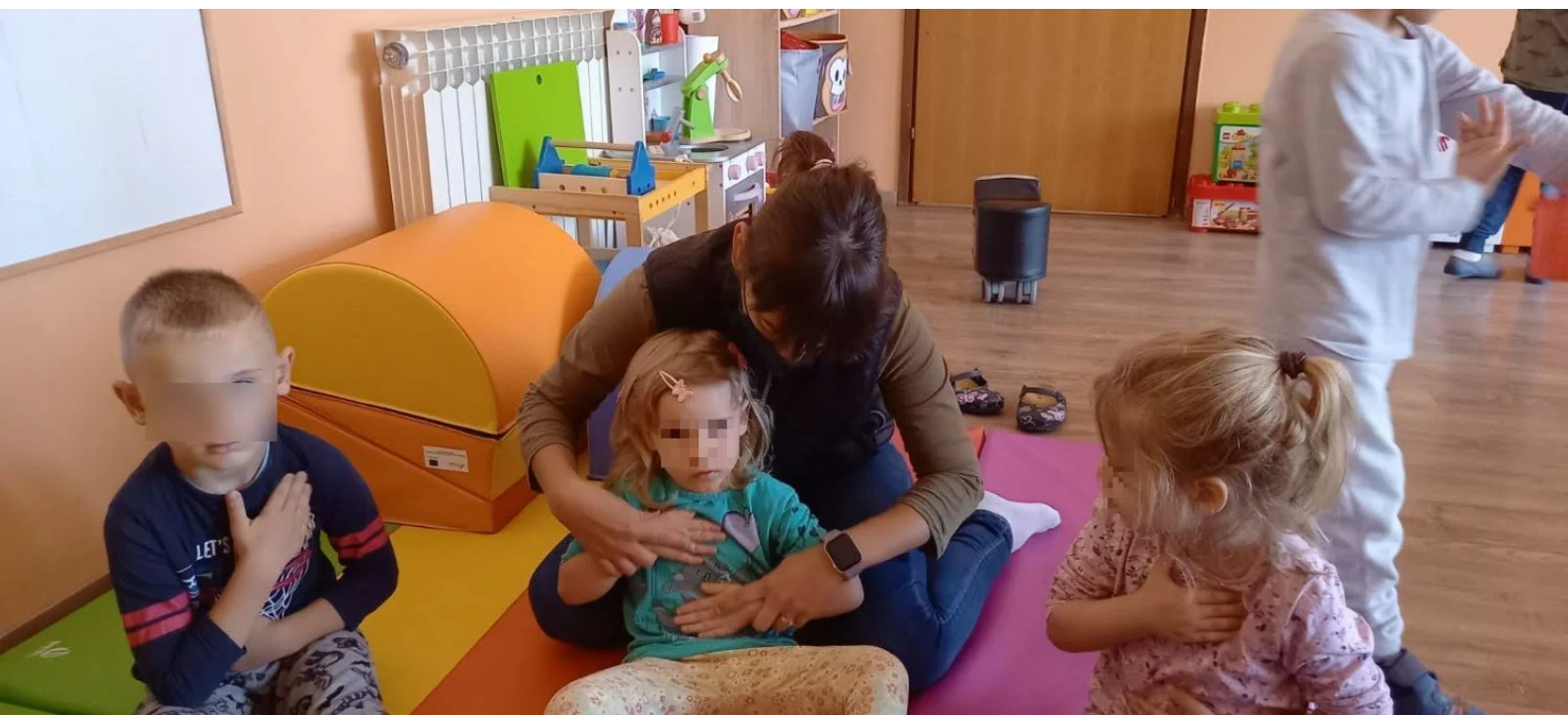
Brain gym

Kao što smo već pisali ranije, velik problem je nedostatak stručnog kadra.