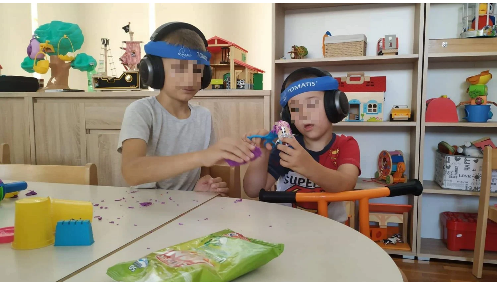
Tomatis metoda

Naš cilj je osigurati jednake mogućnosti za svu djecu, a to znači potpuno besplatne sve usluge", ističe Matin.