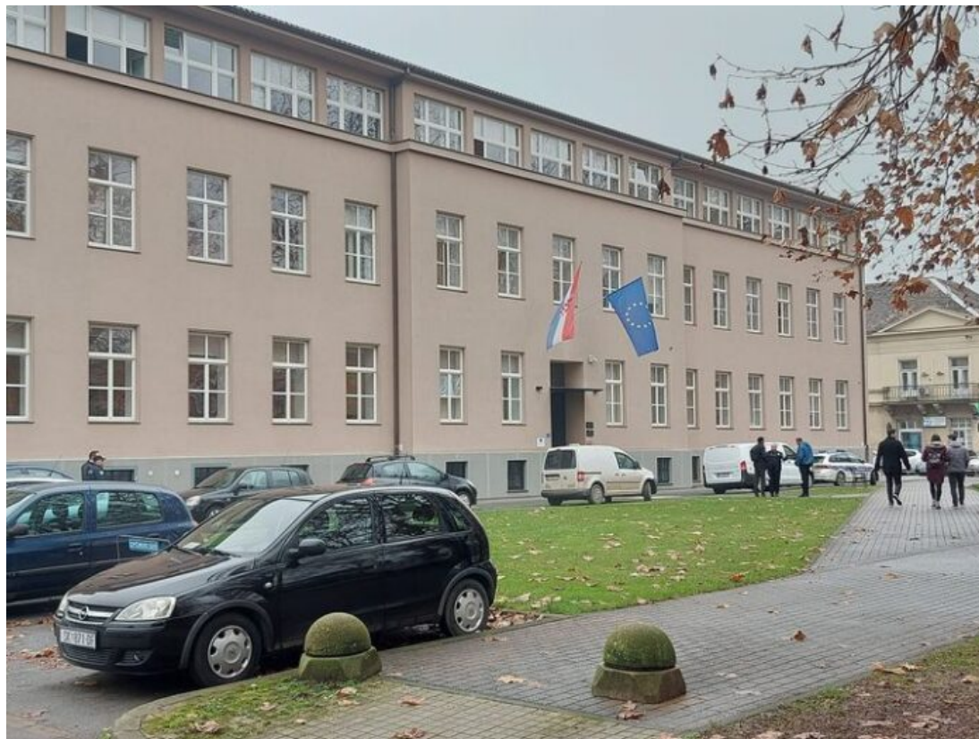
Zgrada Županijskog i Općinskog suda u Sisku će također u obnovu

Osim Sisačko-moslavačke županije i većih gradova – Siska, Gline te Petrinje – obnovu objekata kojim upravljaju na potresom pogođenom području provode i druge jedinice lokalne samouprave, kao i državne institucije te ustanove.