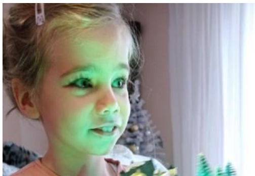
Kampanja za Loreen: Pomozite 5-godišnjoj Riječanki da učini prvi samostalni korak!