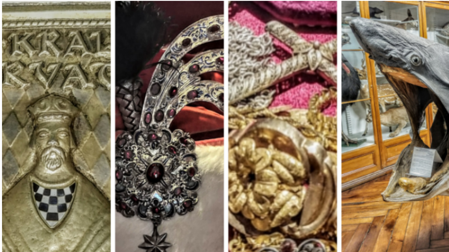
Ilustracija / Blaga & misterije

Autor: Ured za blaga & misterije 26/12/2022, 19:51