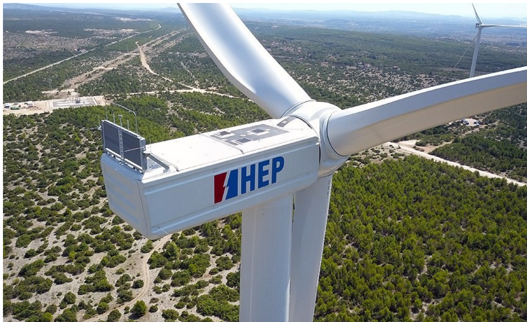
vjetroelektrana Korlat