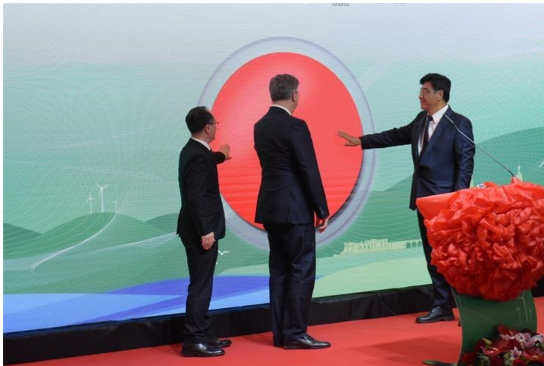
oremijer pušta u probni rad VE Senj