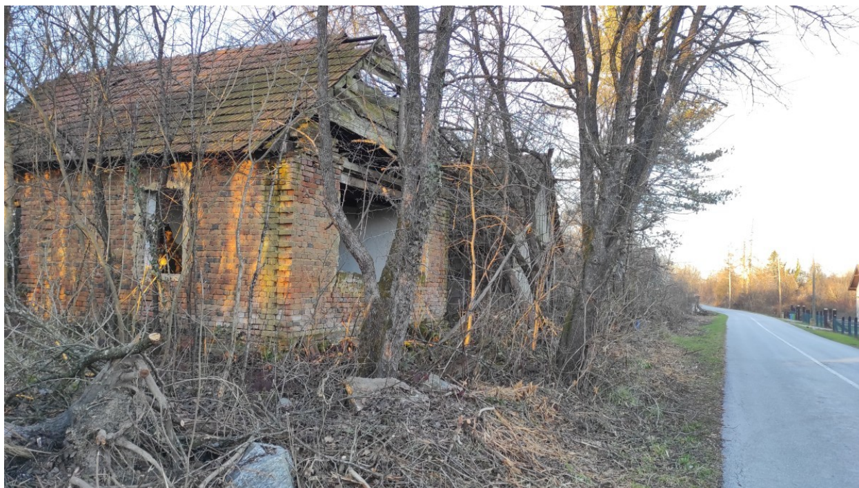
Ruševine su problem koji se ne smije gurati pod tepih

Postoje i nekretnine koje su zapuštene jer nisu legalizirane. Iako je Zakon o postupanju s nezakonito izgrađenim zgradama imao dva puta prolongaciju roka do kada su se mogli podnijeti zahtjevi za legalizaciju zgrada, postoje brojne zgrade za koje nisu predani zahtjevi te je dio njih zapušten. Brojni su razlozi zbog kojih građani ali i pravne osobe i JLS nisu predali na vrijeme zahtjeve za legalizaciju (materijalni, imovinsko-pravni ...).