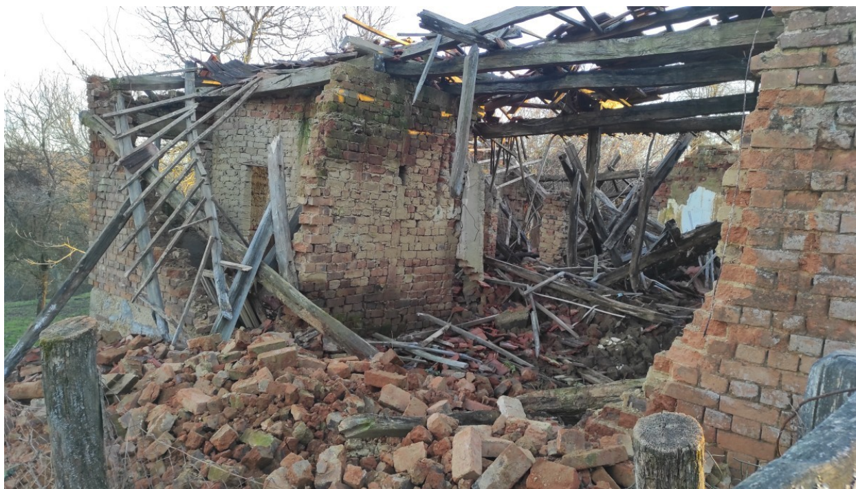
Otužne prizore ruševina gledamo desetljećima - dokad?

"Općepoznata je situacija kako se tijekom 20. stoljeća u Hrvatskoj prosječna veličina posjeda u poljoprivredi uglavnom usitnjavala , dok je u većini dobro vođenih zemalja proces išao u suprotnom smjeru kako bi se osigurala rentabilnost poljoprivredne proizvodnje. U čitavom nizu zemalja zapadne Europe postoje dizajnirana zakonska rješenja pomoću kojih se prevenira nastanak navedenih procesa", objašnjava prof. Tica.