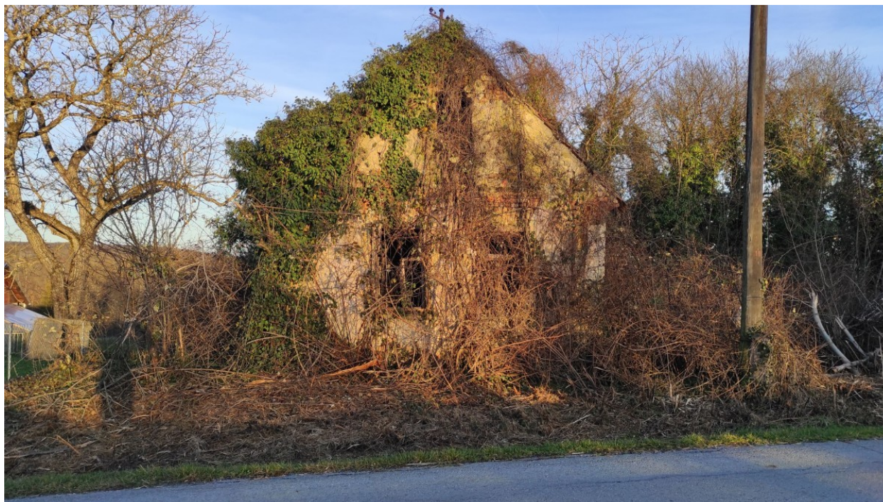
Ima li rješenja za ovakve ruševine?