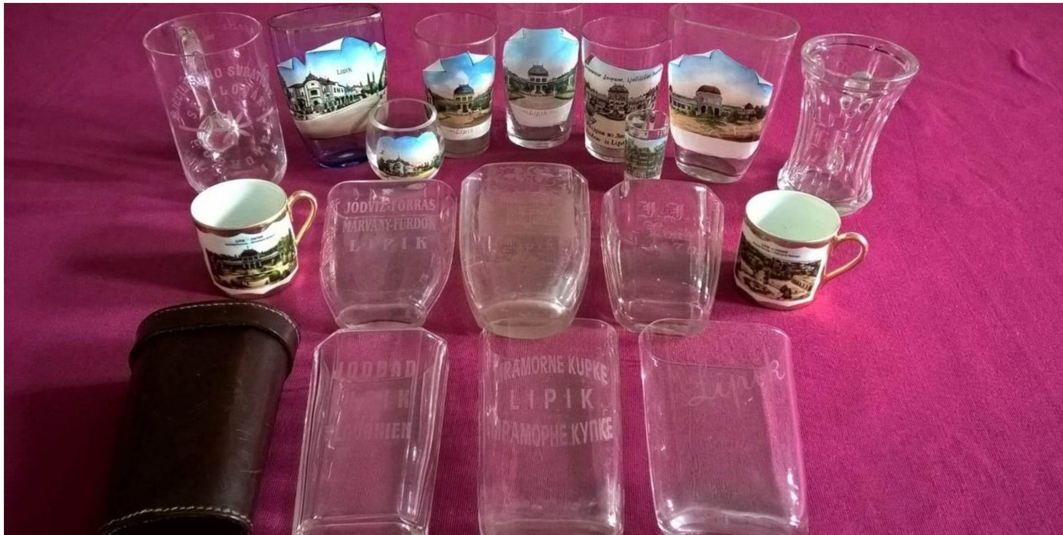
Dio zbirke kupališnih čaša s motivom Lipika