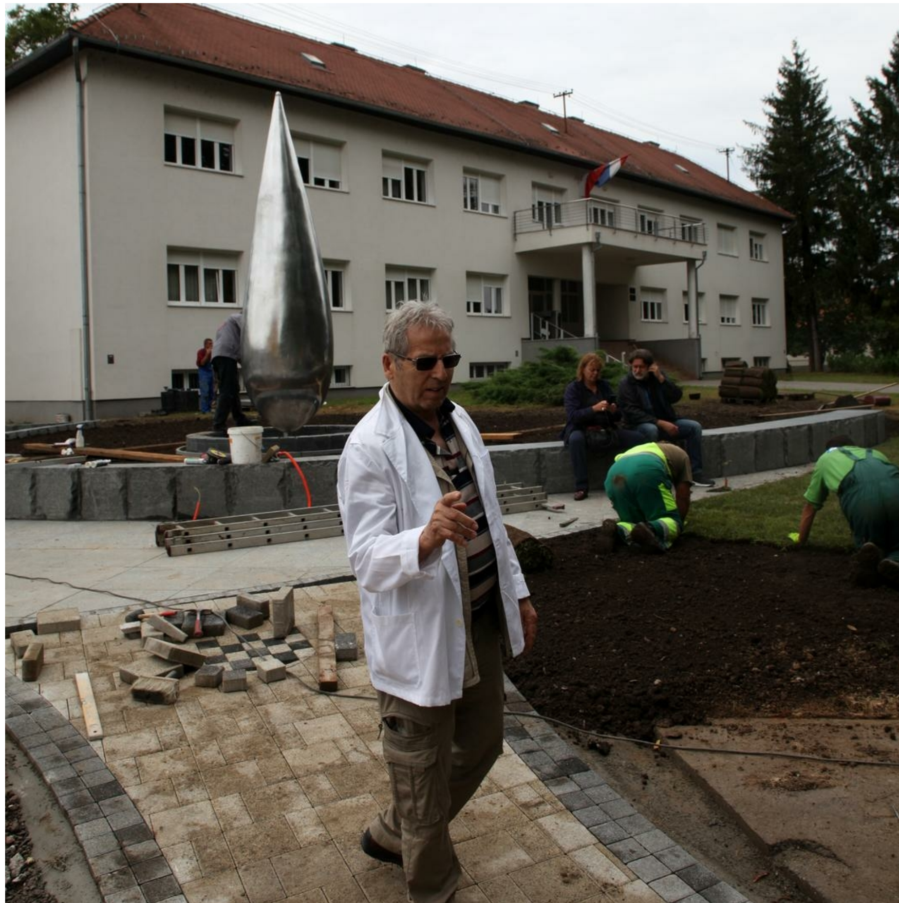
2015., Glina – Postavljanje spomenika poginulim braniteljima i civilima u Domovinskom ratu akademskog kipara Pere Jelisića.