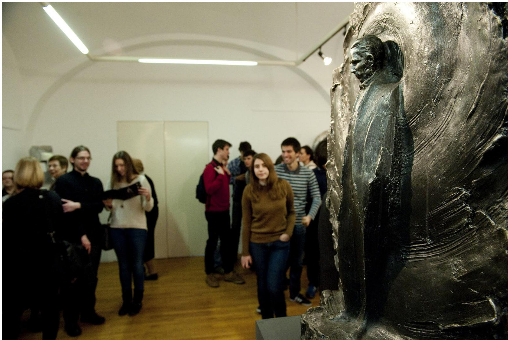
70. obljetnica smrti Nikole Tesle, Hrvatska akademija znanosti i umjetnosti – izložba skulptura posvećenih Nikoli Tesli akademskog kipara Pere Jelisića.

izraz kroz trodimenzionalne oblike i tijela – i enciklopedijski uostalom definirano kao oblikovane, klesane, rezane, lijevane ili sastavljene od elemenata u čvrstom materijalu i materijalu koji može u određenom vremenu zadržati željeni trodimenzionalni oblik, nadaje se, kao grana likovne umjetnosti, kao najpogodnije. Spomeniku Čovječanstva, autoreferentno i skoro tautološki, ono pravi „spomenike trajnije od mjedi“.