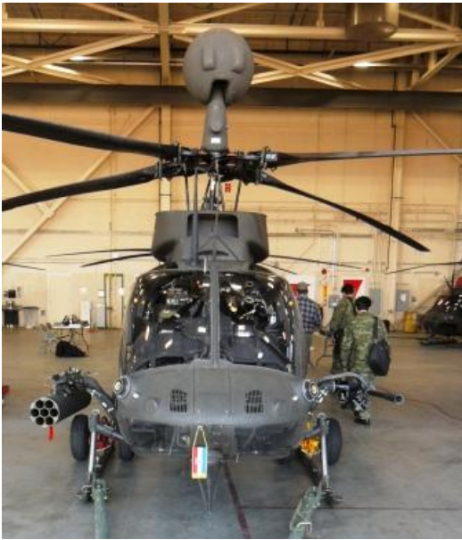
SAD su Hrvatskoj donirale helikoptere OH-58D Kiowa Warrior

Kao drugo , od 2006. je Republika Hrvatska korisnica i raznih oblika „pomoći neobračunate vrijednosti“ – što se odnosi na korištenje pojedinih usluga državnoga sustava SAD, čime se onda štede vlastita sredstva, novci i resursi. Dok se ovdje svojedobno spominjalo usluge prijevoza u pojedine inozemne misije, te pomoć putem korištenja posuđene američke opreme na dalekim inozemnim terenima – ovaj tip pomoći je izgleda posljednjih godina ipak bio u određenoj stagnaciji.