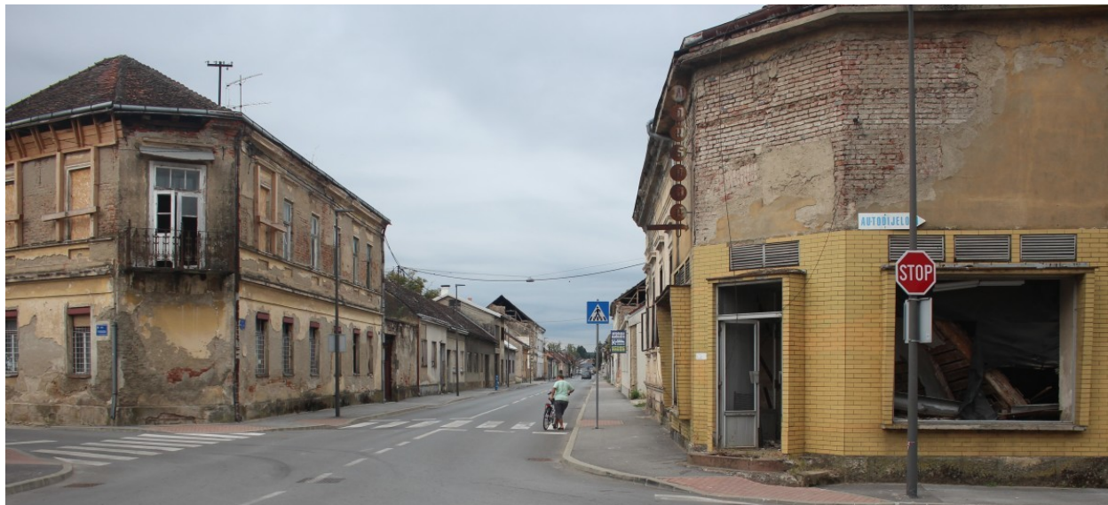
Glina koja je pretpjela i strašan potres

Svijest građana ide u smjeru da će broj takvih objekata biti smanjen na minimum. "Sve više se vlasnici pojedinih ruševina ili parcela samostalno javljaju i prijavljuju da bi riješili taj problem", zaključuje gradonačelnica Blažević.