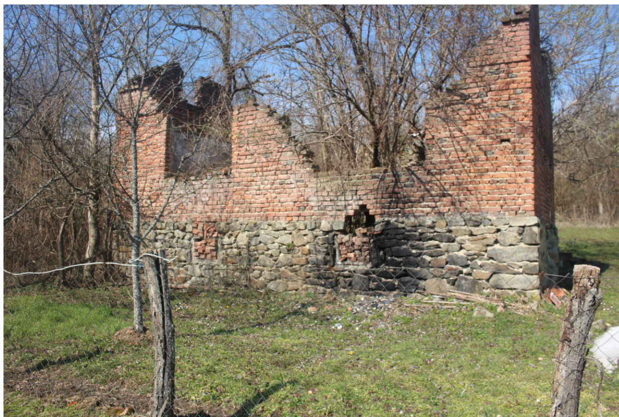
Ruševni objekti veliki su hrvatski problem

I gradonačelnik Gline Ivan Janković smatra da je to kompleksna priča koja treba puno zalaganja, truda, rada i energije kroz suradnju svih razina lokalne, županijske i državne vlasti. "To iziskuje, kako oni kažu međuresornu suradnju, ali u praksi baš i ne funkcionira. Nije isto primjenjivati zakone u Zagrebu, na obali i Glini".