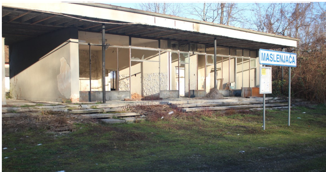
Napuštena zgrada željezničke stanice

Obrazlaže to postupkom dodjele poljoprivrednog zemljišta gdje neke jedinice u zakonskim rokovima donose potrebne planove, raspisuju natječaje i donose odluke, dok su neke druge u tom poslu potpuno zakazale. Drugi problem s povjeravanjem bilo kakvog državnog posla lokalnoj razini je, naglašava Miletić, poznato prebacivanje "loptice" odgovornosti kojemu su hrvatski građani često izloženi.