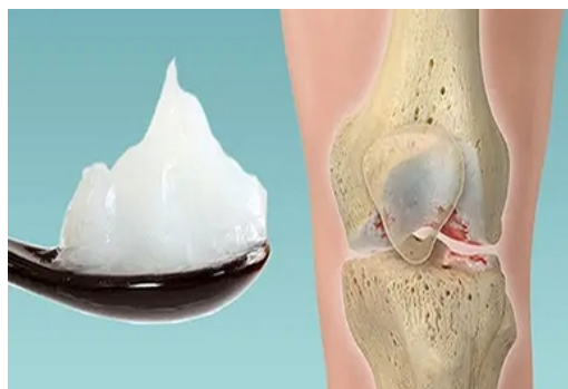
Koljeno kao novo u 6 min. Moraš samo...