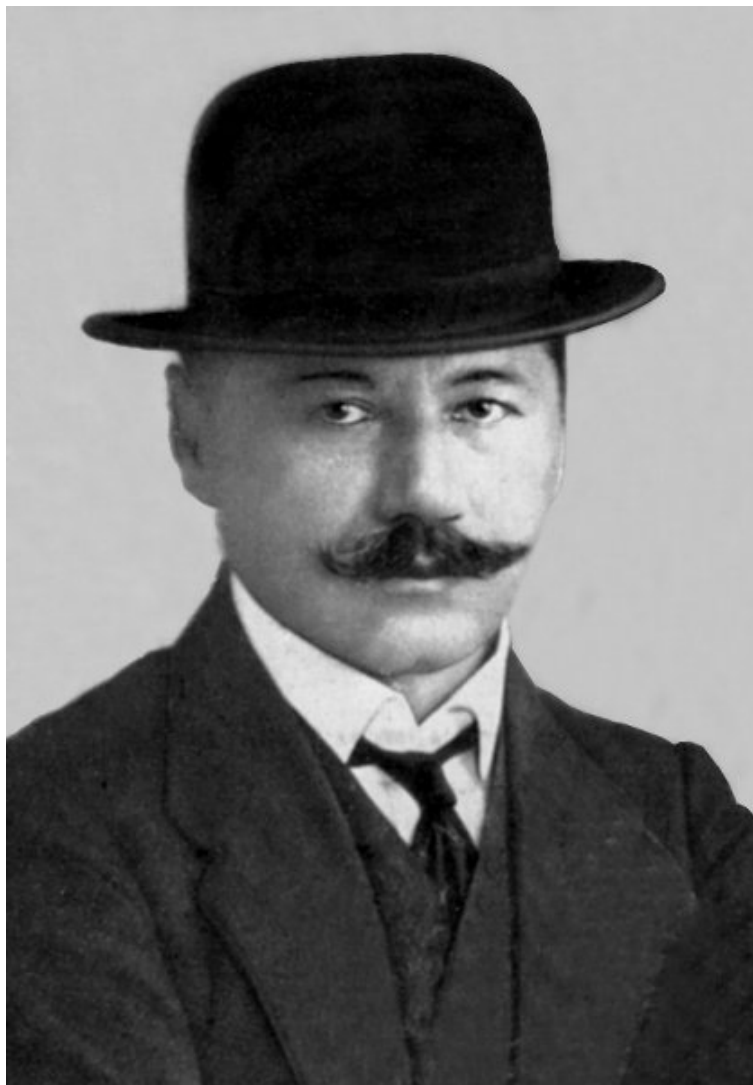
Antun Radić, hrvatski etnolog, političar i publicist

To je teško za reći. Već su rimski autori u antici te kasnije kršćanski svećenici od srednjega vijeka bilježili pučke običaje i predaje na našem povijesnom prostoru. To nije nešto novo. No sistematizacija se počinje provoditi od 19. stoljeća. U Hrvatskoj su to svakako dvije osobe. Prva je Antun Radić, hrvatski etnolog, političar i publicist koji je bio drugi urednik Zbornika za narodni život i običaje Južnih Slavena , prvog hrvatskog etnološkog časopisa koji je izdavala i još uvijek izdaje Hrvatska akademija znanosti i umjetnosti (u nekim razdobljima poznata i kao JAZU, Jugoslavenska akademija znanosti i umjetnosti).