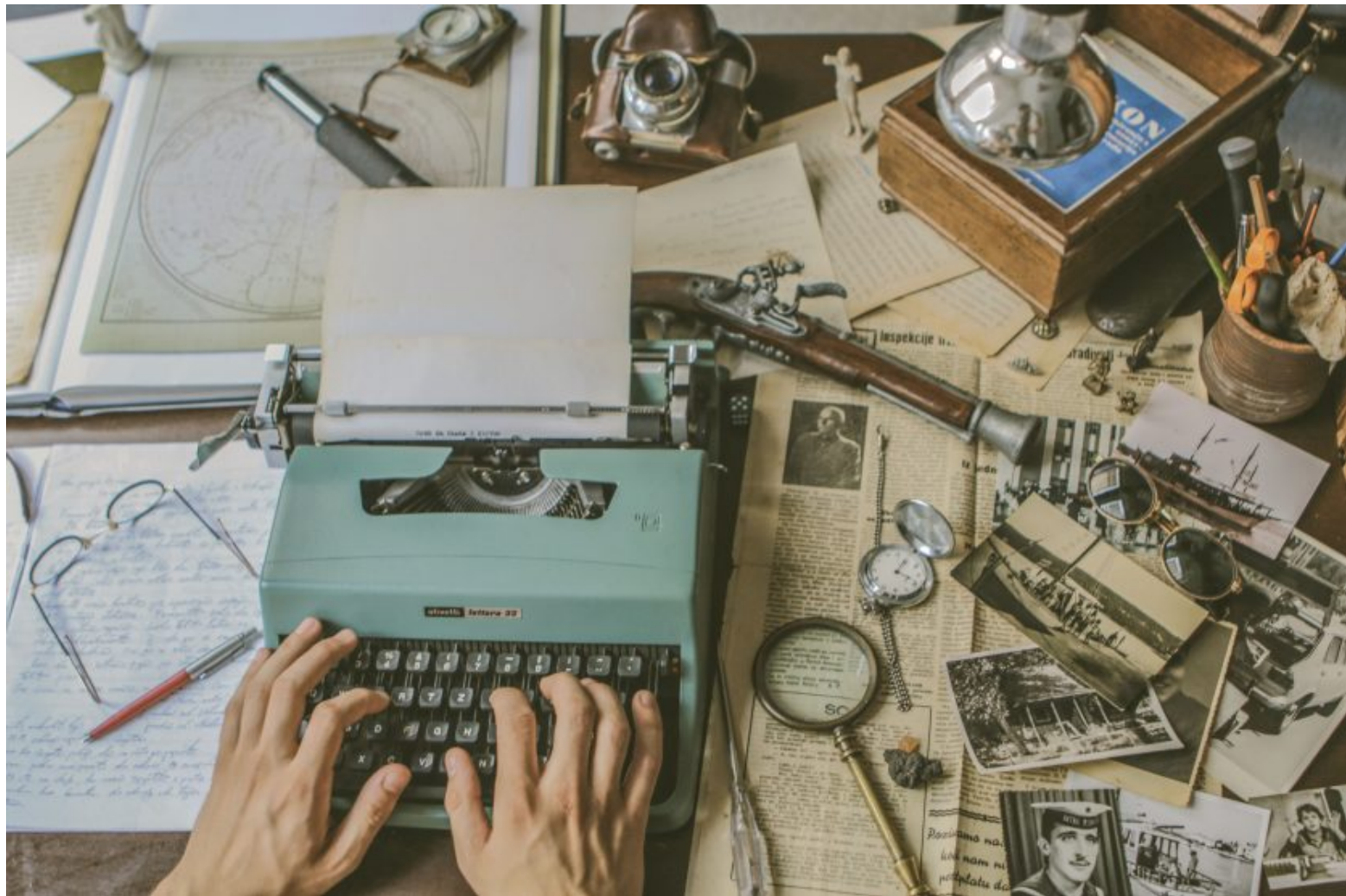
Ilustracija / FOTO: Blaga & misterije

Autor: Ured za blaga & misterije 22/12/2022, 17:45