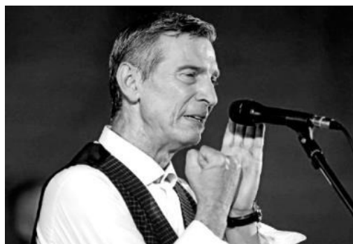
Na Massimovom profilu objavljena poruka koju je snimio samo tri dana prije smrti