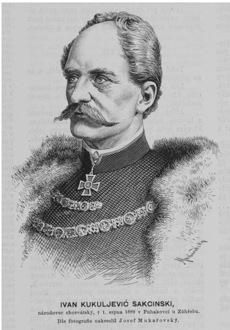
Kukuljević Sakcinski, Ivan, hrvatski povjesničar, književnik, bibliograf i političar

Do polovice 20. st. to je bila osnova i glavni uzorak za terenski etnografski zapisivački rad, a tek će se od tridesetih godina 20. stoljeća početi uključivati znanstvenici, kao što su etnolog Milovan Gavazzi, etnomuzikolog Božidar Širola i drugi. Od 1896. do 2022. godine HAZU je izdala ukupno 62 knjige Zbornika, koji se danas zove samo Zbornik za narodni život i običaje.