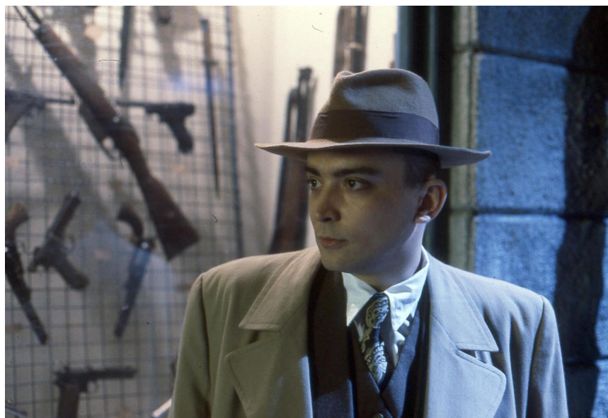
Scena iz filma

Ne zna se zašto su režiseri i autori stavili odrednicu „komedija“ u naslov. Možda iz provokativne ironije – komedija je podvrsta drame, da ne zaboravimo – kao književne vrste za igranje na pozornici. Možda iz očaja, znajući ono što mi nismo tada znali. Ko će ga znati. Jer ta žanrovska odrednica u svojoj osnovnoj definiciji stajala je u apsolutnoj suprotnosti, doznat ćemo kasnije, sa životopisom, ali i radom i čitavom višom, a strašnom simbolikom ličnosti čije je ime stajalo u naslovu. Nismo tada znali o toj ličnosti gotovo ništa, pa nismo znali da čitamo tu razinu. Oblanda, stil, omiljeni heroji muzike i suvremene umjetnosti bili su draži i važniji.