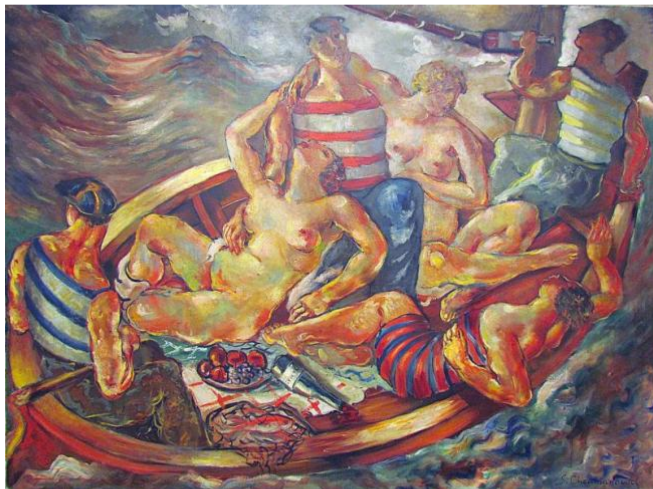
Pijani brod, Sava Šumanović

Šumanović je bez sumnje jedan od tri ili četiri najznačajnija srpska modernistička slikara, to je iznad i prije svega činjenica koju treba odrediti i postaviti.