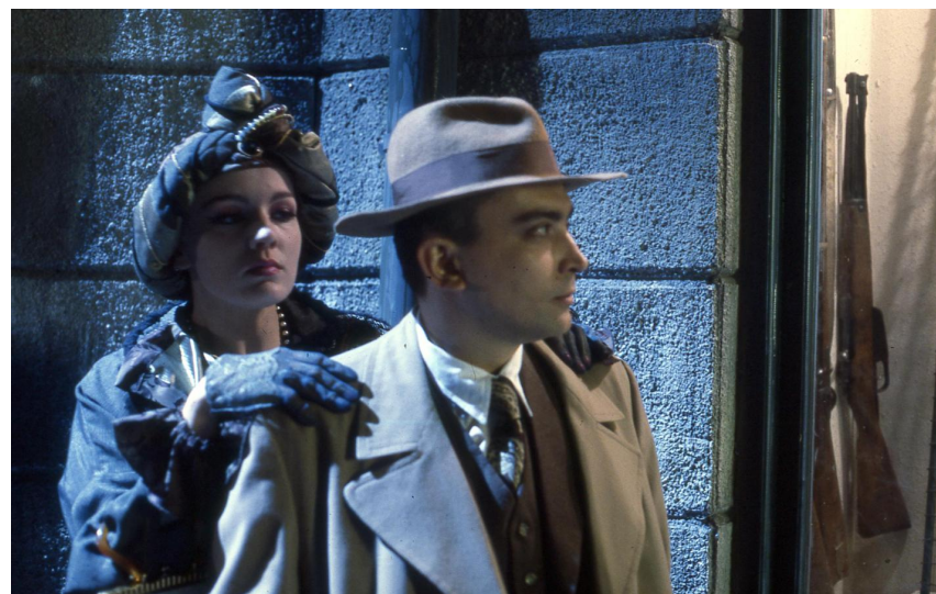
Scena iz filma

Tek godinama kasnije, i zapravo tek sa slomom države, srušit će se tabu, a na puni i pravi način izaći će dubinsko i slobodno tematiziranje čovjeka iz naslova – Save Šumanovića , slikara, srpskog i jugoslavenskog, veličanstvenog. I najtragičnijeg od svih.