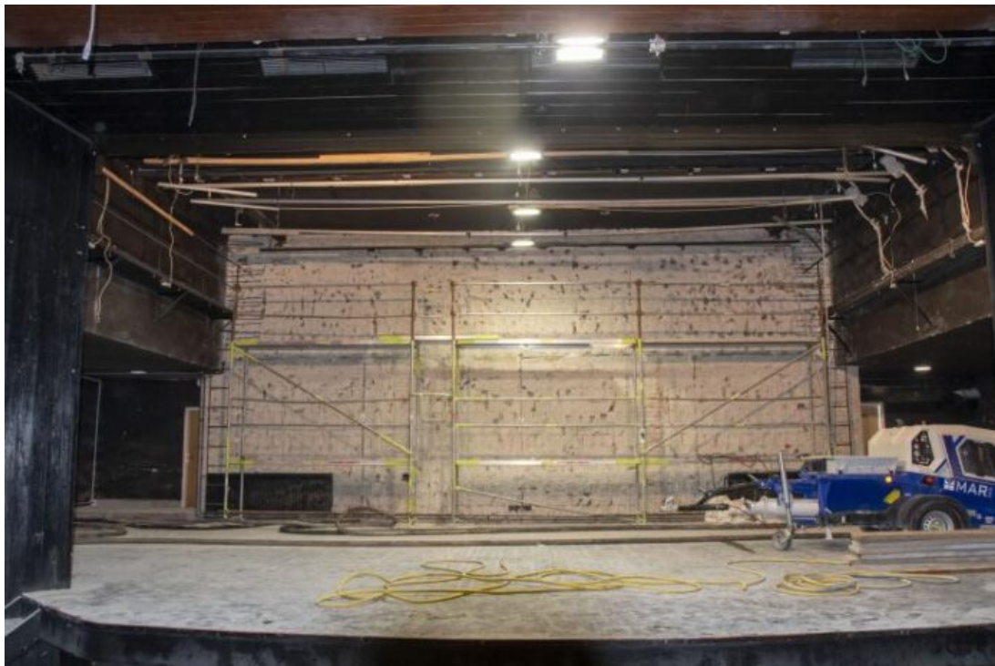
Radovi na obnovi Kazališta 21