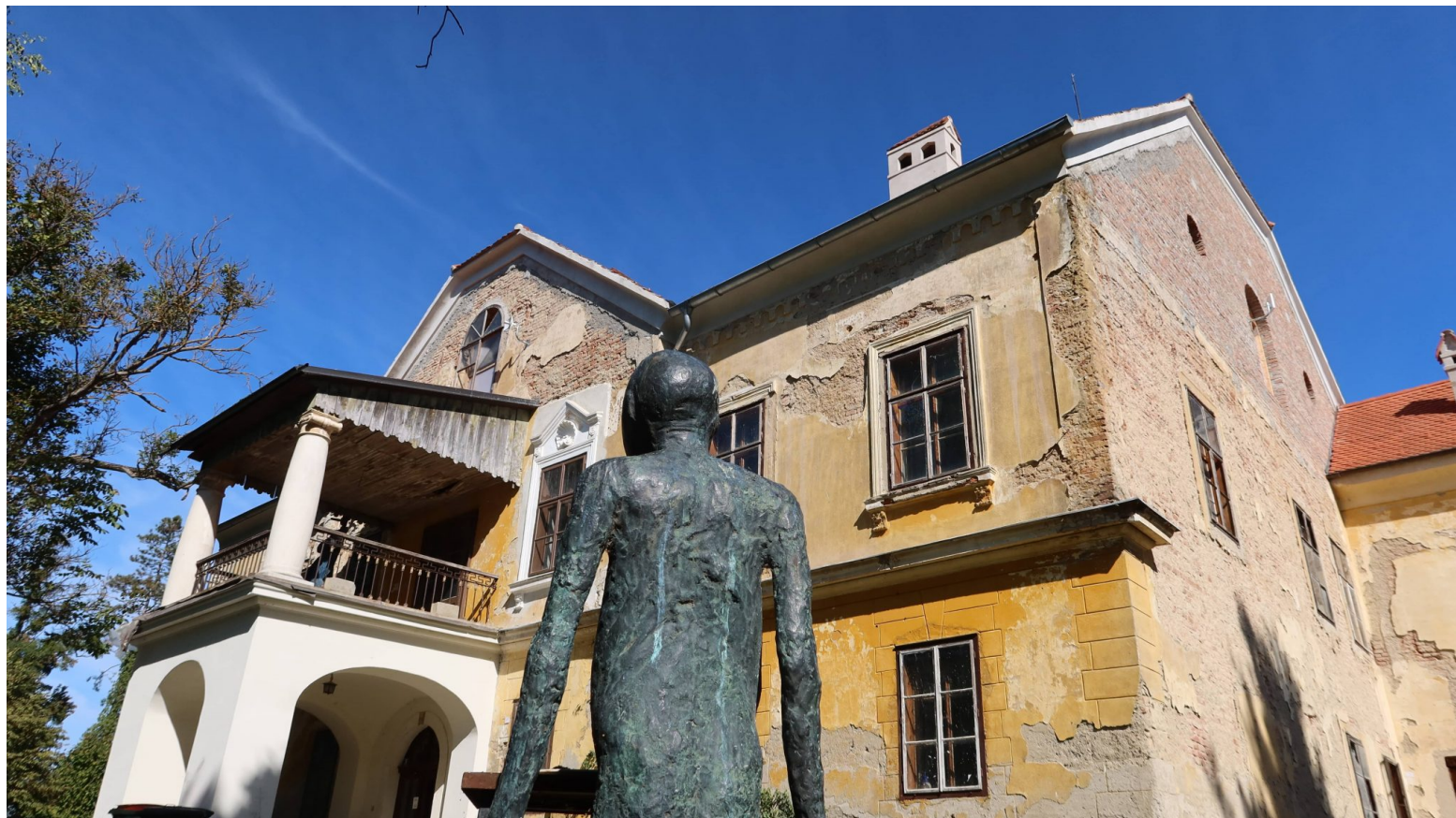
Dvorac Oršić – Jakovlje okružen je Međunarodnom parkom skulptura

identiteta i pojedine lokalne zajednice koja teži linearnom razvoju pa se korijenski razilaze već u samoj pretpostavci djelovanja.