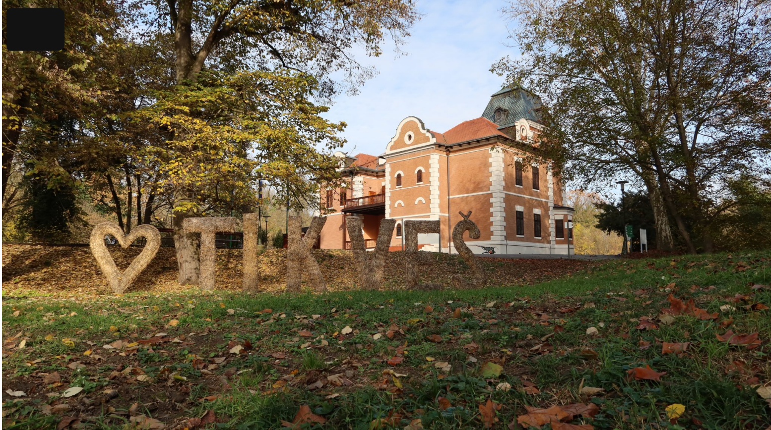
U nedavno obnovljenom dvorcu Tikveš nalazi se Prezencacijsko-edukacijski centar

Dodatno, zbog kruto formatiranog formulara uslijed potrebe za standardizacijom postupka registracije i upisa, stručnjaci nailaze na poteškoće pri ispunjavanju prijavnica za upis u Registre. Samim time, cjelovita i sveobuhvatna sistematizacija, a onda i provedba očuvanja ove vrste kulturnih dobara je uistinu otežana. Kada pak usporedimo prethodno opisan slučaj čipke, cilj registracije je ipak krajnje dostižan.