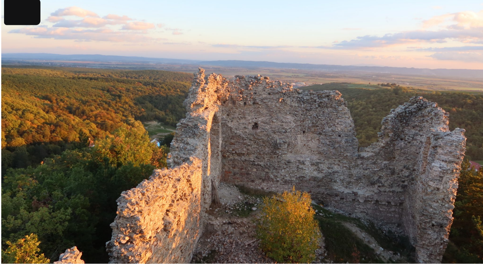
Stari grad Velika

Suštinski, kulturna se baština može podijeliti u nekoliko kategorija: nepokretnu, pokretnu, nematerijalnu i arheološku, kako i navodi Ministarstvo kulture RH. Nepokretna kulturna baština podrazumijeva pojedinačnu građevinu ili grupu građevina, kulturno-povijesne cjeline i krajolike dok se pokretna kulturna baština odnosi na spomenike i pripadajuće inventare. Nematerijalna kulturna baština jesu folklorne prakse, svakodnevni predmeti iz nekih minulih vremena, običaji i kodeksi ponašanja. Zapravo sve ono apstraktno i opipljivo što uspješno prenosi svjedočanstvo kulturnog djelovanja i utjecaja na zajednicu.