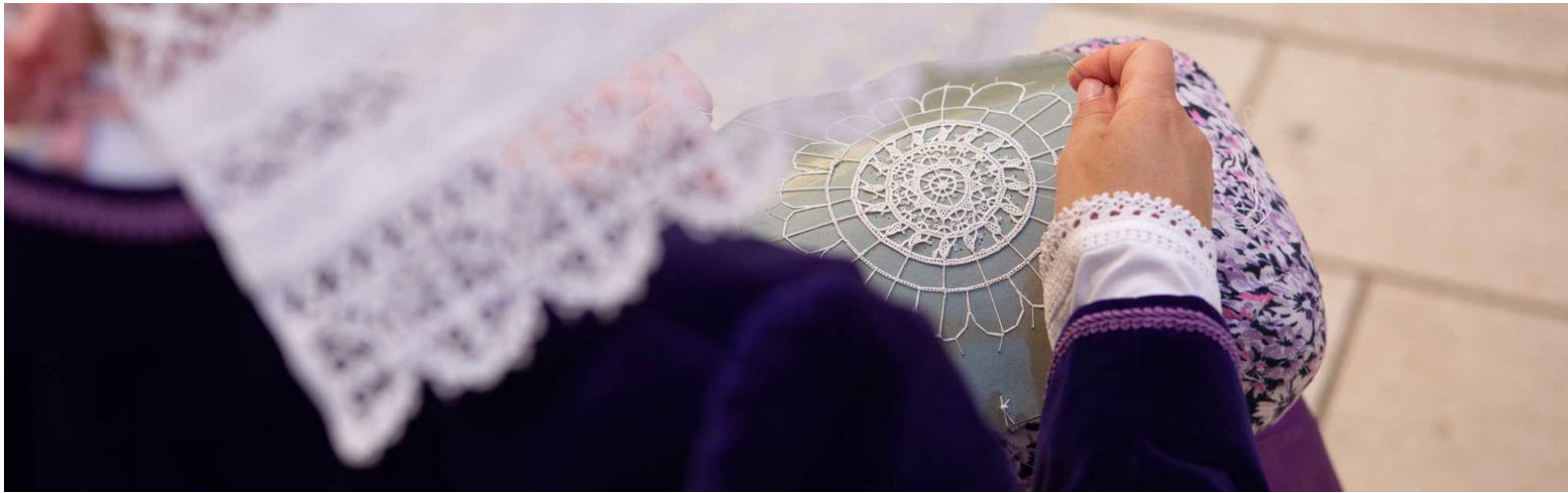
Prikaz tkanja čipke / CC

Kada je Organizacija Ujedinjenih naroda za obrazovanje, znanost i kulturu (UNESCO) 1972. godine usvojila Konvenciju o zaštiti svjetske kulturne i prirodne baštine, ona je značila zaštitu materijalne baštine. Spomenutih vještina, procesa i konteksta nije bilo. Period u kojem su i vještine postajale prihvaćene kao nematerijalna kulturna baština tada je tek počinjao. Hrvatska je čipka tako na Reprezentativni popis nematerijalne kulturne baštine čovječanstva u svojstvu nematerijalnog dobra kao vještina upisana 2009. godine. Ono što ju čini tako baštinski posebnom jesu njeni stvaratelji, odnosno stvarateljice.