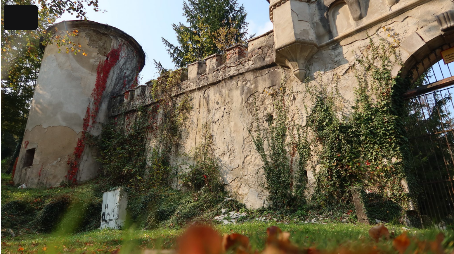
Stari grad Bosiljevo predmet je imovinsko – pravnog spora

Svaka lokacija, predmet ili običaj predstavlja priču za sebe, iako brojne dodirne točke ukazuju na zajedničke probleme. Ono što je zajednička premisa svoj baštini jest samoodrživost. Na tragu te misli, pozivam čitatelja da mi se pridruži u danima koji dolaze u seciranju stanja hrvatske kulturne baštine danas.