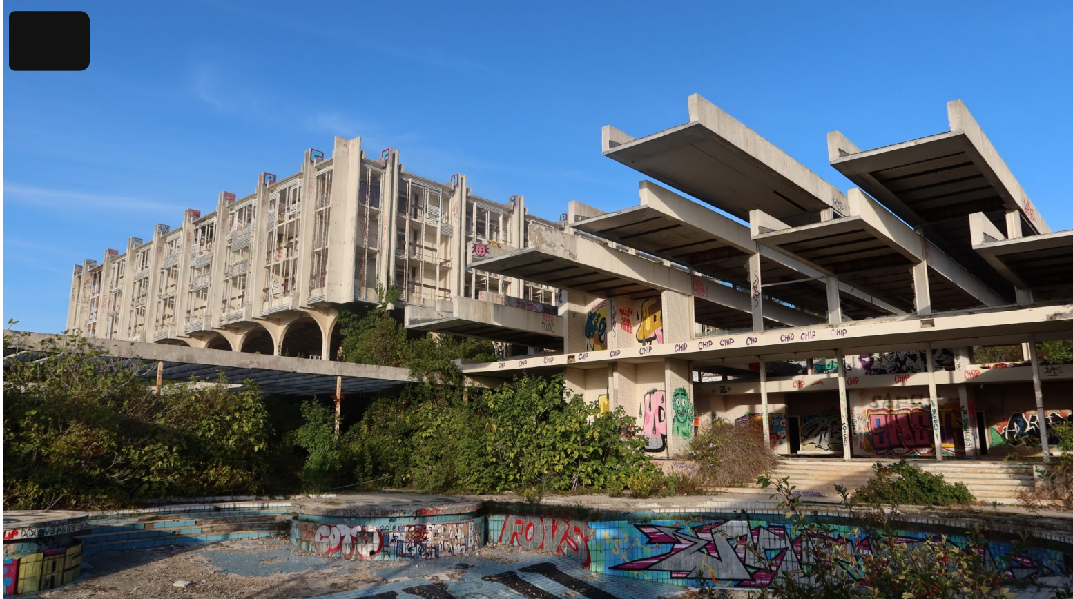
Kompleks Hotela Haludovo kod Malinske nije zaštićeno kulturno dobro

Razni su razlozi koji su doveli do tog stanja. U međusobnoj korelaciji ili pojedinačno neki od njih su sustavni nemar i neadekvatno održavanje, ograničena ili nedostatna financijska sredstva, vrlo zakomplicirani imovinsko-pravni odnosi, ratne prilike, nepropisna obnova i rekonstrukcija, nerazvijena svijest o direktnoj povezanosti nacionalnog i kulturnog identiteta s kulturnom baštinom i njene iznimne važnosti, odnosno odsustvo kulturnog ponosa.