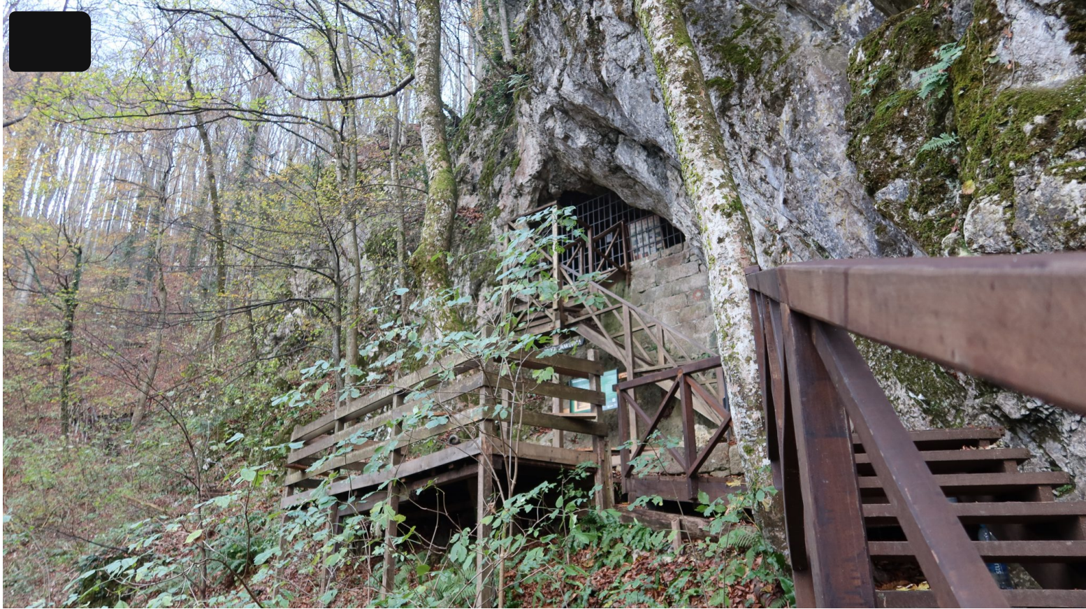
Grob grofa Jankovića, Jankovac

“Radi se o metaproizvodu koji se bazira na povijesnim fragmentima. Drugim riječima, baština kao takva ne postoji – ona se stvara, oblikujući tako i svojevrsan simbolički kapital. Tako kulturno nasljeđe postaje vrijednost, koja se odnosi kako na prošlost, tako i na budućnost.” (Bendix 2007:8-9). U obje konstrukcije se uočava naglasak na dinamici baštine, koja je vremenski protežna i aktivna u svim dimenzijama.