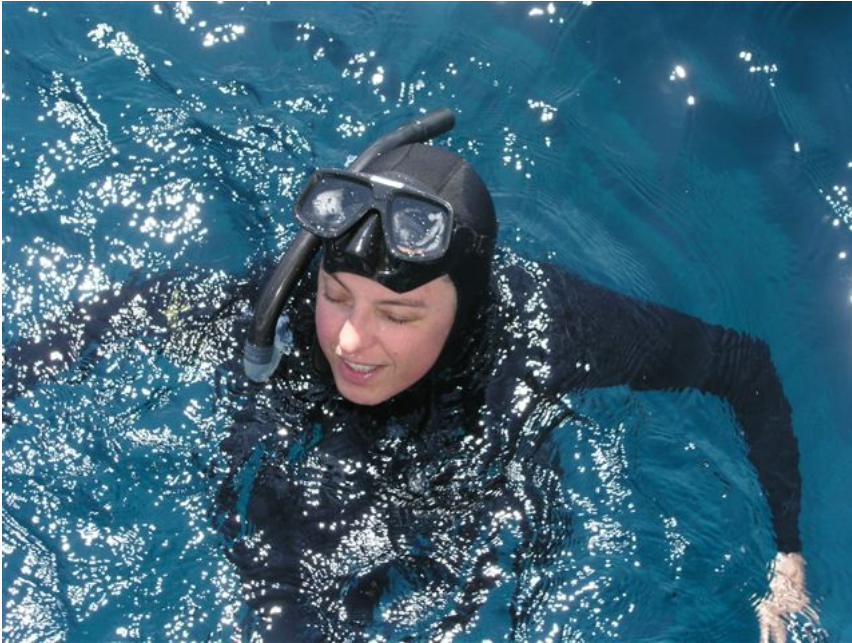
Dušica na površini mora

Na posljednjim se izborima pokazalo da se korumpirane stranačke mašinerije mogu skidati s vlasti. Pula je samo jedan od slučajeva. Ali Pula je dobar primjer za još jednu pojavu u politici zbog koje nepovjerenje u politiku opstaje. S vlasti je skinut IDS, a za gradonačelnika izabran “nezavisni” od kojeg se puno očekivalo, a koji je vrlo brzo pokazao neznanje, nesposobnost i zastupanje privatnih umjesto javnih interesa, pa je i razočaranje još veće.