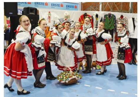
Promicanje kulture i tradicijskih običaja nacionalne manjine Češke obeci Bjelovar (8)