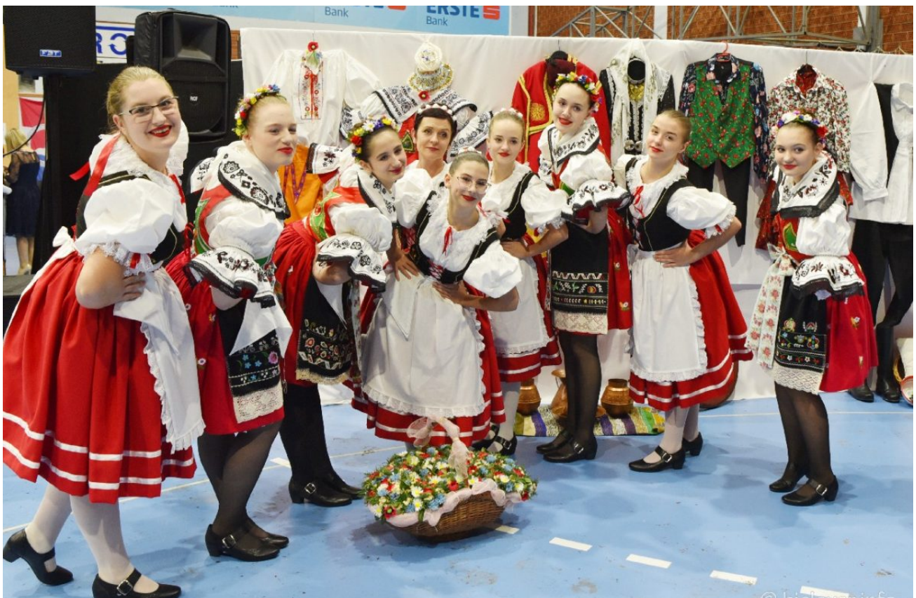
Promicanje kulture i tradicijskih običaja nacionalne manjine Češke obeci Bjelovar (8)

3. prosinca 2022. — KULTURA — Piše Branka Sobodić