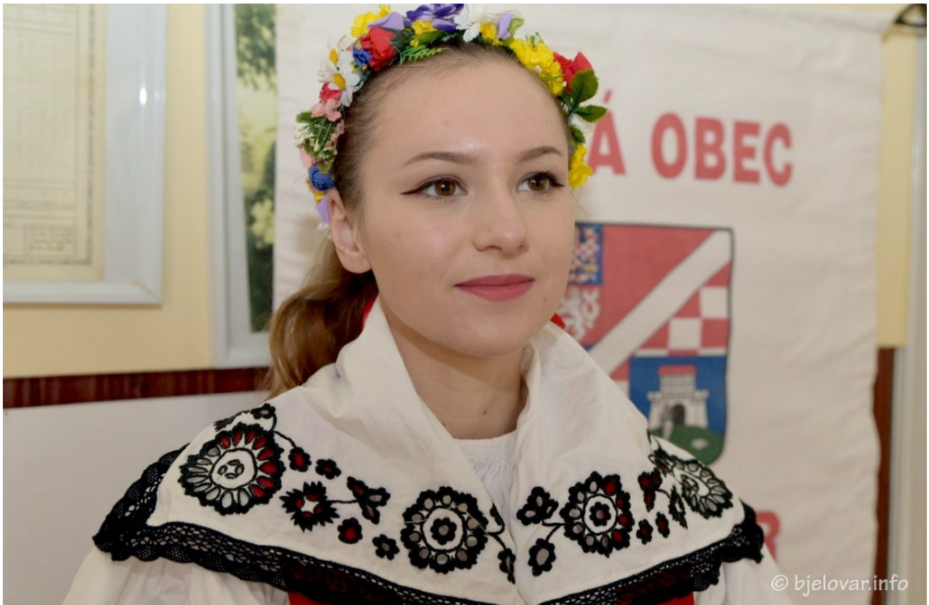
Promicanje kulture i tradicijskih običaja nacionalne manjine Češke obeci Bjelovar (7)

28. studenoga 2022. — KULTURA — Piše Branka Sobodić