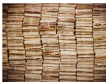
U 2022. štrajkali radnici