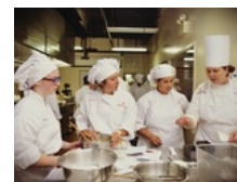
"U Dubaiju je jeftinije" –