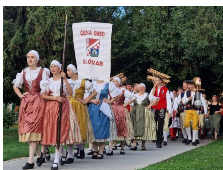
Promicanje kulture i tradicijskih običaja nacionalne manjine Češke obeci Bjelovar (5)