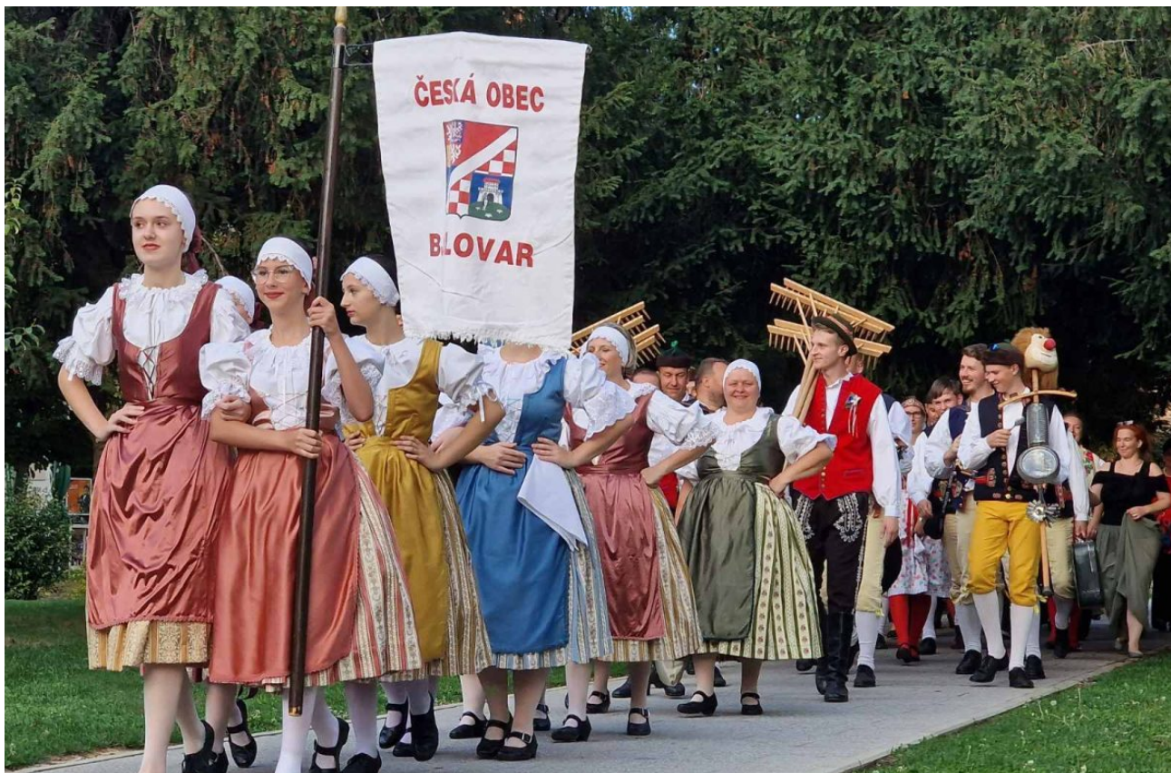
Promicanje kulture i tradicijskih običaja nacionalne manjine Češke obeci Bjelovar (5)

23. studenoga 2022. – KULTURA – Piše Branka Sobodić