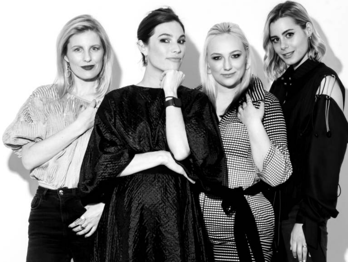
FEMME NOUVELLE – VOL. 2

U iznimnom izdavačkom pothvatu Aquariusove urednice Lane Čulig kroz tri kompilacije, na 10 + 8 + 8 pažljivo odabranih primjera prikazana je ekspanzija ženskog autorstva kakva dosad nije viđena u ovim krajevima. Lanin projekt još nije završen, to je work-in-progress koji će vrlo izvjesno dobiti četvrti, moguće i peti nastavak, ali se iz ženske perspektive već sad može postaviti kao solidan kontraargument nostalgичnom prizivanju bolje prošlosti i prejakim fascinacijama novovalnom euforijom iz 1980-ih ili Fiju Briju masovkama iz 1990-ih.