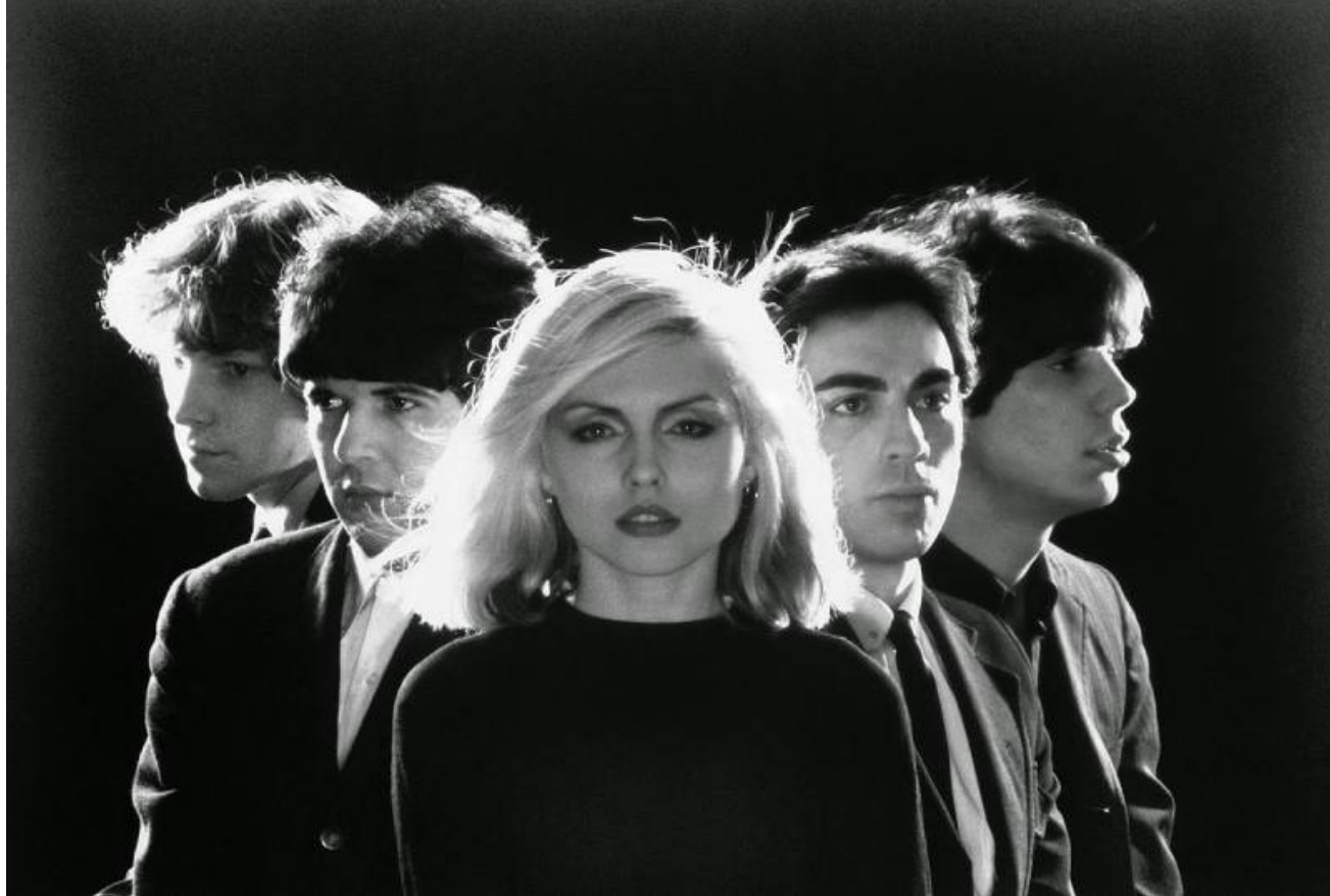
BLONDIE SNIMLJENI 1977.