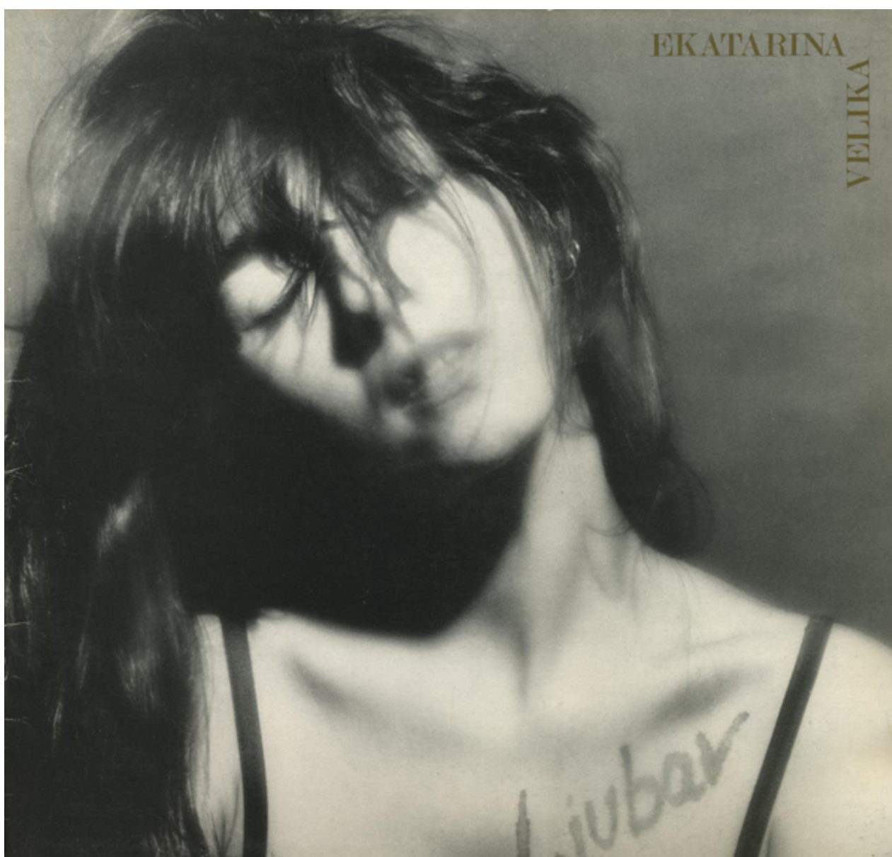
MARGITA STEFANOVIĆ NA NASLOVNICI ALBUMA 'LJUBAV' EKV-A (1987.)

Ranih 1980-ih pojavile su se prve ženske punk grupe novosadske Boye i ljubljanske Tožibabe koje su od samog starta dobro prolazile kod publike, ali su im se neshvatljivo presporo otvarala vrata diskografskih kuća. Tožibabe su tek 1986. uspjele objaviti prvi i jedini EP „Dežeja“. Boye su opasno zapele u pregovorima s Jugotonom koji je tražio komercijalniji materijal pa je njihov debi album „Dosta! Dosta! Dosta!“, beskompromisan feministički manifest provučen kroz Kojinu sirovu produkciju, objavljen tek 1988. na PGP RTB-u.