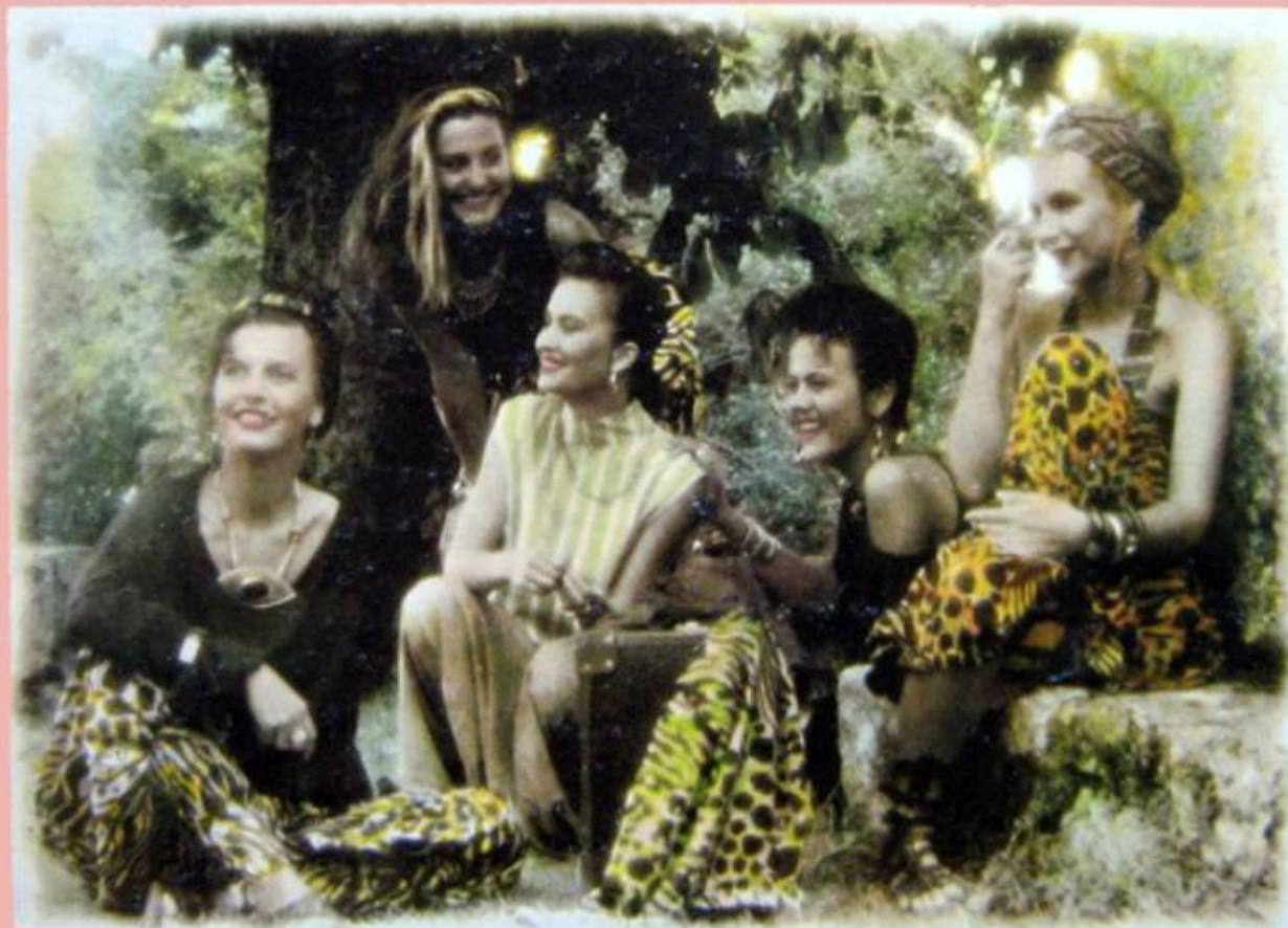
CACADOU LOOK 'TKO MARI ZA ČARI'

U to doba zapaženije nove ženske uloge mogle su se odigrati samo u Cro dance trashu. Na koncertima Fiju Briju koji su do konca 1990-ih bili pravo mjerilo alter rokerskog uspjeha nastupala je isključivo muška ekipa. Nigdje nije bilo mjesta za hrvatsku PJ Harvey ili The Breeders, dok je megapopularnu Alanis Morissette pokušavala odglumiti Severina . U takvom okruženju čak ni vrsna jazz kantautorica Tamara Obrovac nije uspjela biti primjećena s debi albumom „Triade“.