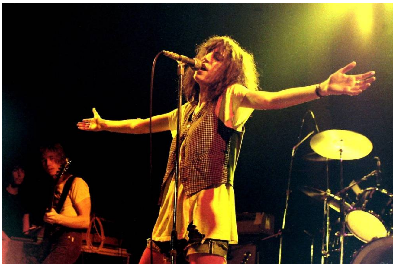
PATTI SMITH SNIMLJENA 1978.

Najprepoznatljivije žensko lice novovalne epohe bila je Debbie Harry , s partnerom Chrisom Steinom okosnica autorskog tima grupe Blondie .