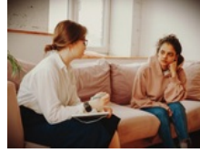
Život ne bi trebao stati zbog