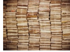
U 2022. štrajkali radnici