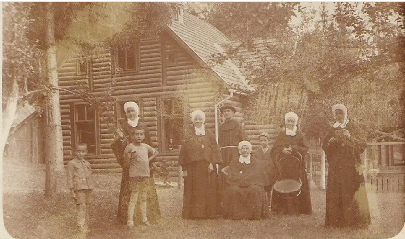
ZABORAVLJENE SUGRAĐANKE (5)