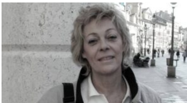
Daša Drndić, književnica čijim će se imenom jednog dana ponositi budući park.

postojeći književni obrazac, ove godine na Odbor za imenovanje javnih površina upućena je građanska inicijativa da se neimenovani budući javni park uz Ulicu Vilima Korajca nazove po Daši Drndić . Osim odavanja počasti istaknutoj književnici, inicijativa već kroz ime zapravo nastoji u lokalnoj zajednici (uglavnom novih zgrada, a time i novih stanara kvarta) osvijestiti da je sadašnja ledina u GUP-u zavedena kao javni park koji bi se na tome mjestu trebao dogoditi. Pritom postoji i određena korelacija između budućeg imena i (buduće) borbe za park, što također komplementira i samu osobu književnice čiji je život bio obilježen (i) borbama.