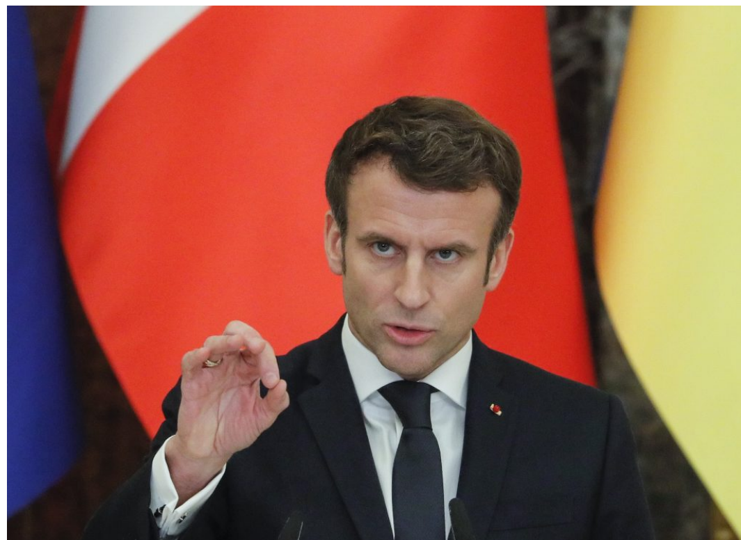
Francuski predsjednik Emmanuel Macron