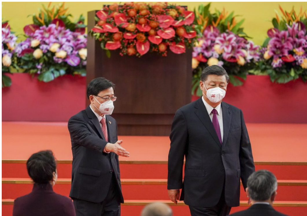
Kineski predsjednik Xi Jinping

Amerika je najjača gospodarska sila na svijetu, ali njezin udio u svjetskom gospodarstvu značajno pada. Na primjer, kad je poslije Drugog svjetskog rata uspostavljen današnji gospodarski svjetski poredak Amerika je imala udjel od oko 50 posto u svjetskom gospodarstvu, sedamdesetih godina taj udjel pao je na oko 35 posto, a danas iznosi „samo” 8 posto. Međutim, postoci bi mogli zavarati stvarni odnos snaga.