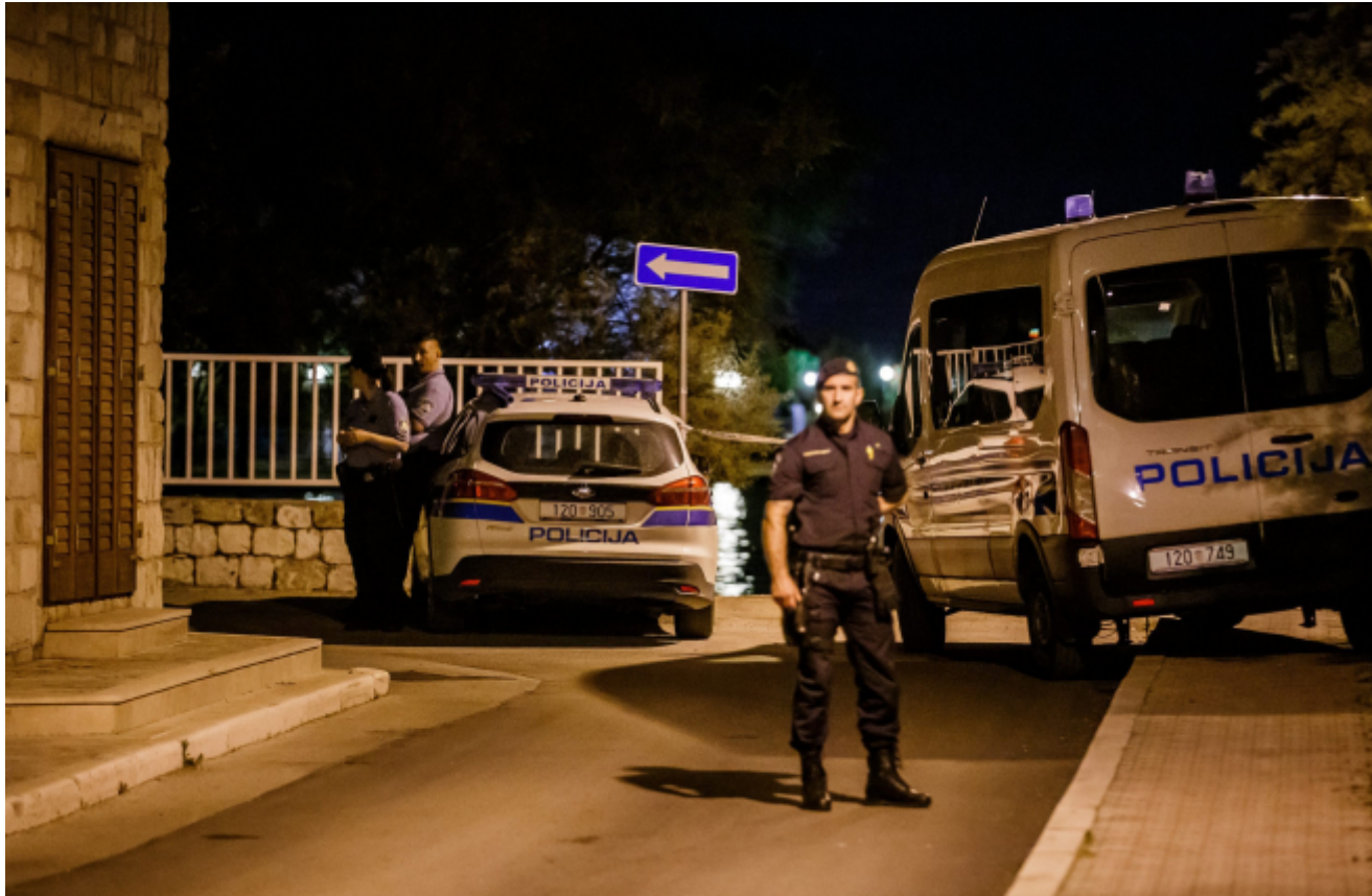
Ilustracija