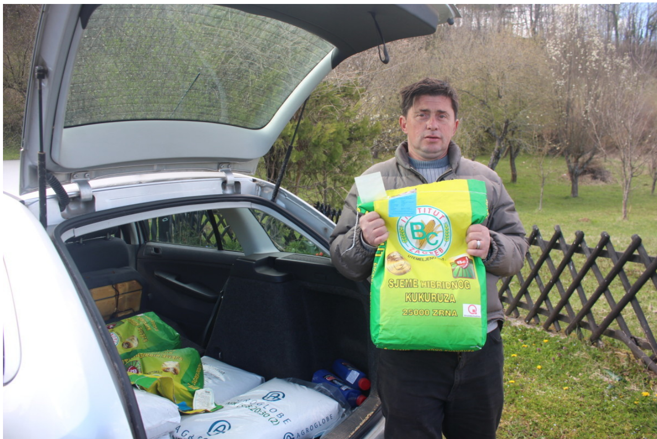
Volonteri su dijelili sjeme i gnojivo