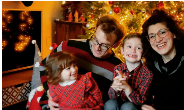
Obitelj van der Sterren

Budući da je njezina djevojčica rođena na proljeće 2019., tog ljeta ona je bila premlena za putovanje u Hrvatsku pa su put i prvi susret s bakom i djedom odgodili za iduću godinu. Proveli su lijepo ljeto i uživali u zajedničkom druženju, međutim, sljedeće planirano putovanje u Hrvatsku morali su otkazati zbog lockdowna .