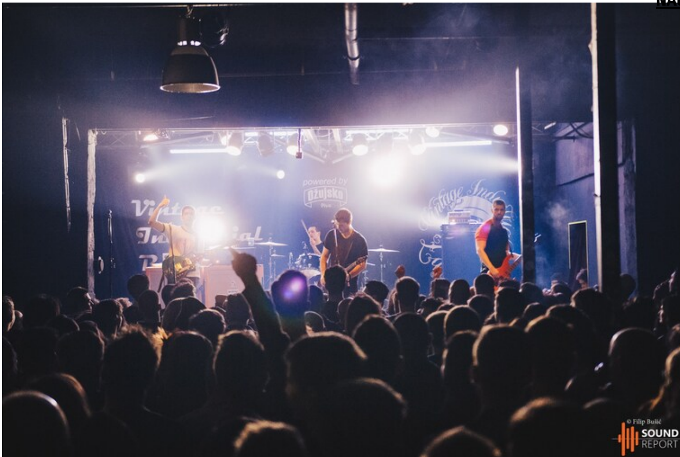
photo: She Loves Pablo, Vintage Industrial Bar