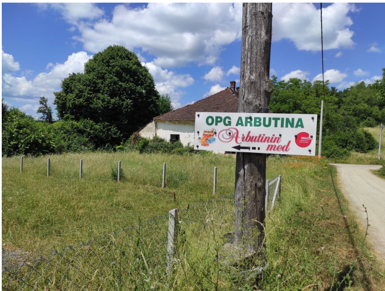
Arbutinin med osvojio je brojne nagrade i odličja

Uz med, radi još samo propolis. Matična mliječ je, objašnjava, sasvim drugi tip proizvodnje pa se time ne bavi. Ali, u pčelarstvu se samo od meda i propolisa, tvrdi, ne može živjeti. Kad je nabavio desetu košnicu shvatio je da će mu trebati puno vremena kako bi od meda imao kupce pa je pet-šest godina prodavao rojeve, najčešće pčelarima u Dalmaciji.