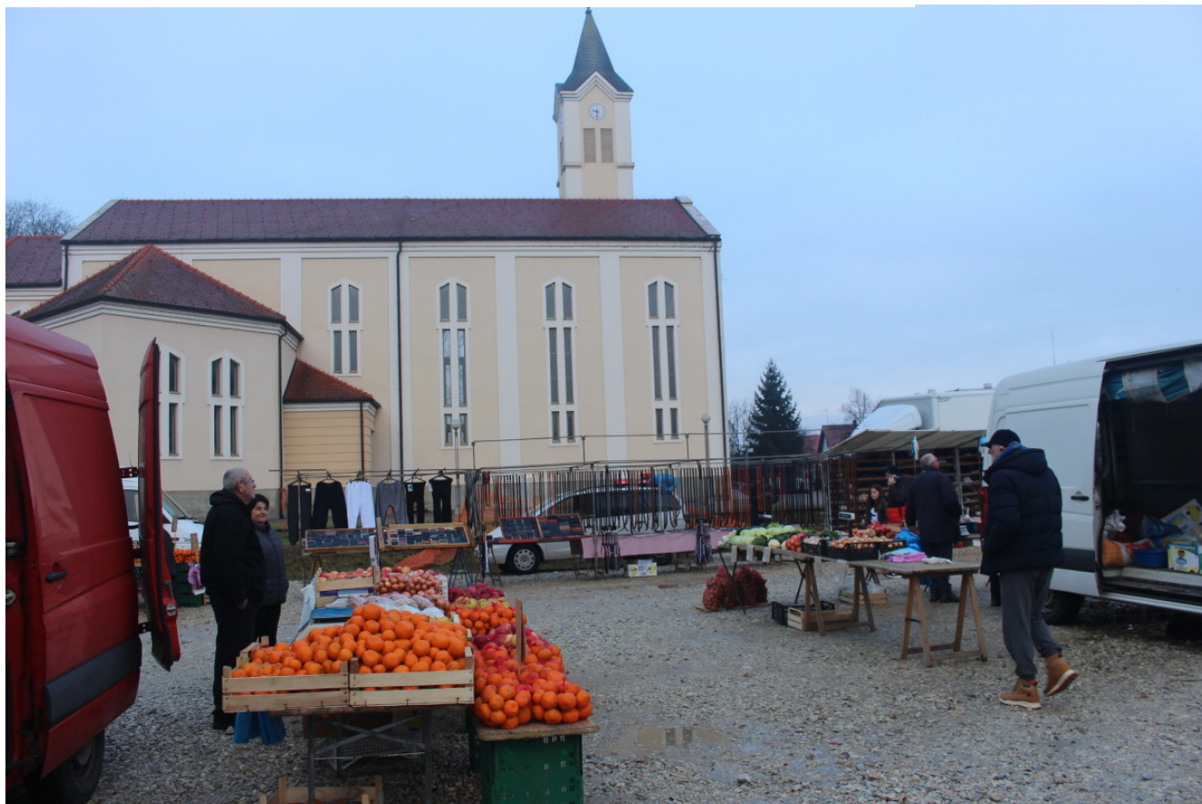
Tržnica u Glini

Naglašava kako se nemaju kome žaliti, niti koga zvati. "Lovci dođu tek kad je sve obrano i završeno. Pokupe ono što je uhranjeno s našim žitom. Kad ih zovemo ne dolaze, nemaju vremena. Očekujemo pomoć od lovaca, a zapravo mi njima pomažemo"; dodala je.