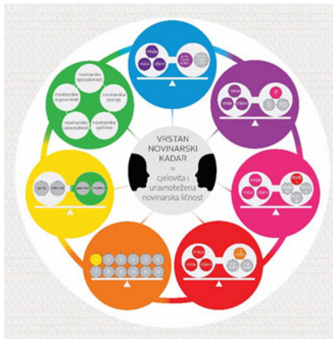
Izradila Z. V.: Izvor: prilagođeno prema Vukić, 2017: 236

novinarsko obrazovanje o održivom razvoju, novinarsko obrazovanje za održivi razvoj i održivo novinarsko obrazovanje (Vukić, 2019). Teza održivog visokoškolskog sustava za obrazovanje novinara temelji se na holističkoj obrazovnoj paradigmi kojoj cjelovitost, univerzalnost i društvena načela održivosti proizlaze iz socijalnih, demokratskih i humanističkih vrijednosti (Vukić, 2019). Jamac tome je sustavno strateško upravljanje visokoškolskim sustavom za obrazovanje novinara u sinergiji s ostalim društveno povezanim sustavima što omogućava pretpostavku da bi se uspješno utjecalo i na promjenu drugih sustava, prvenstveno medijskoga.