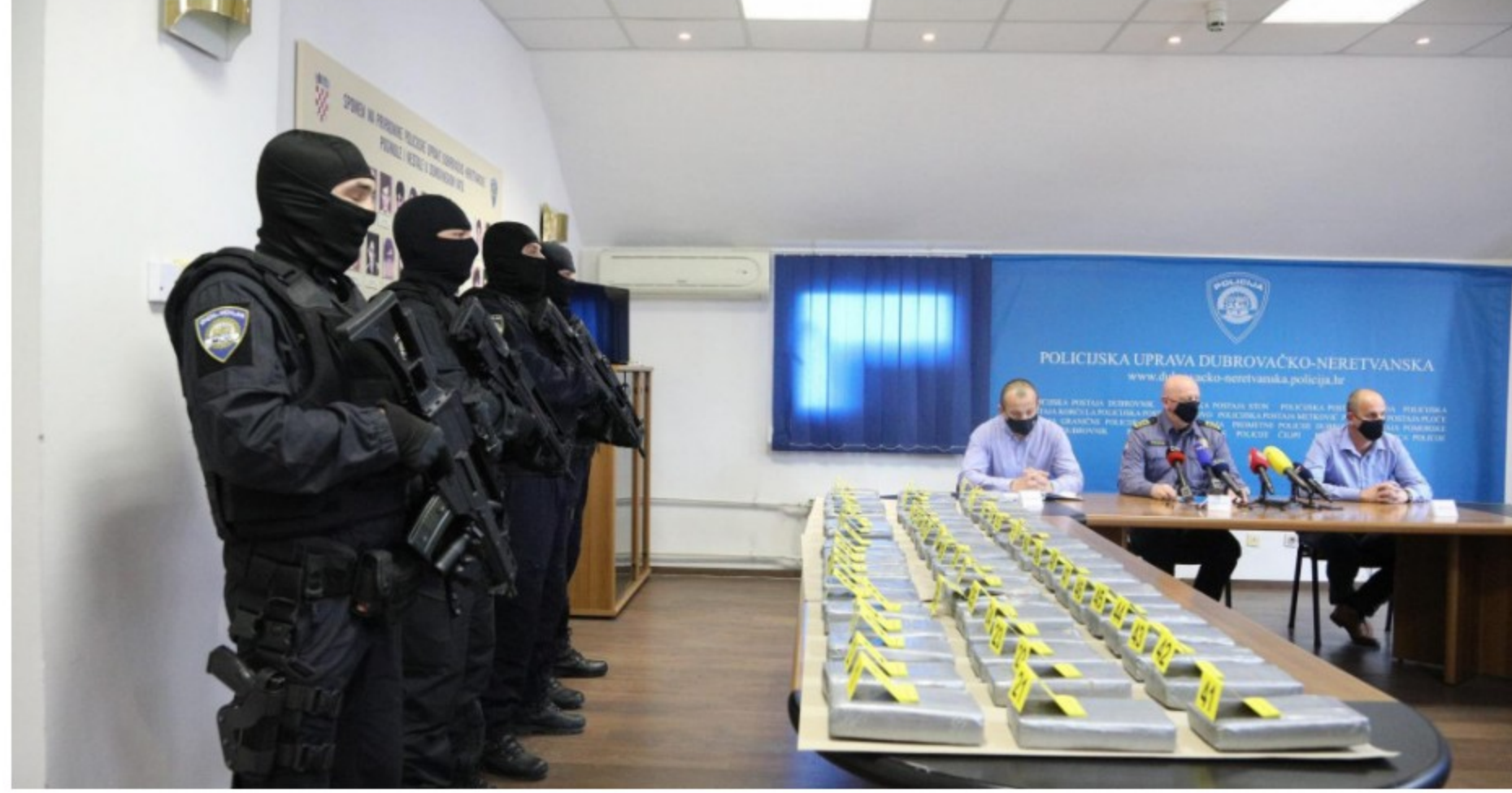
Zapljeni kokaina u Pločama