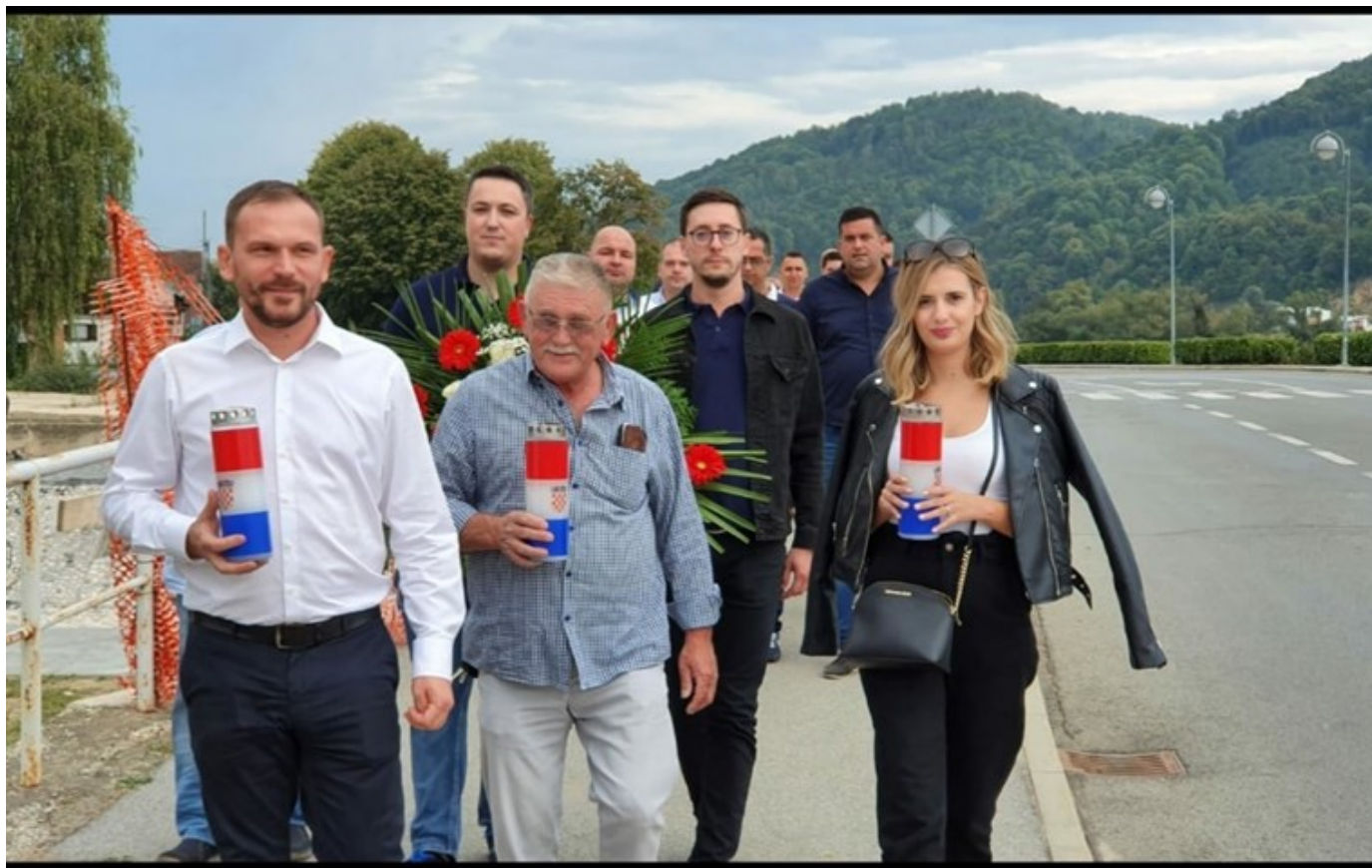
NAJMOĆNIJA ŽENA VELIKOGORIČKOG HDZ-A

Osobnog sam stava kao i stranka kojoj pripadam, da se žena treba prepoznati na temelju sposobnosti i zalaganja, a ne da nas se isključivo percipira kao „žensku kvotu“ koju treba zadovoljiti. U tom smislu HDZ se bori za prisutnost žena temeljenu na njihovim kvalitetama i programima kojima mogu doprinijeti zajednici u kojoj žive i rade.