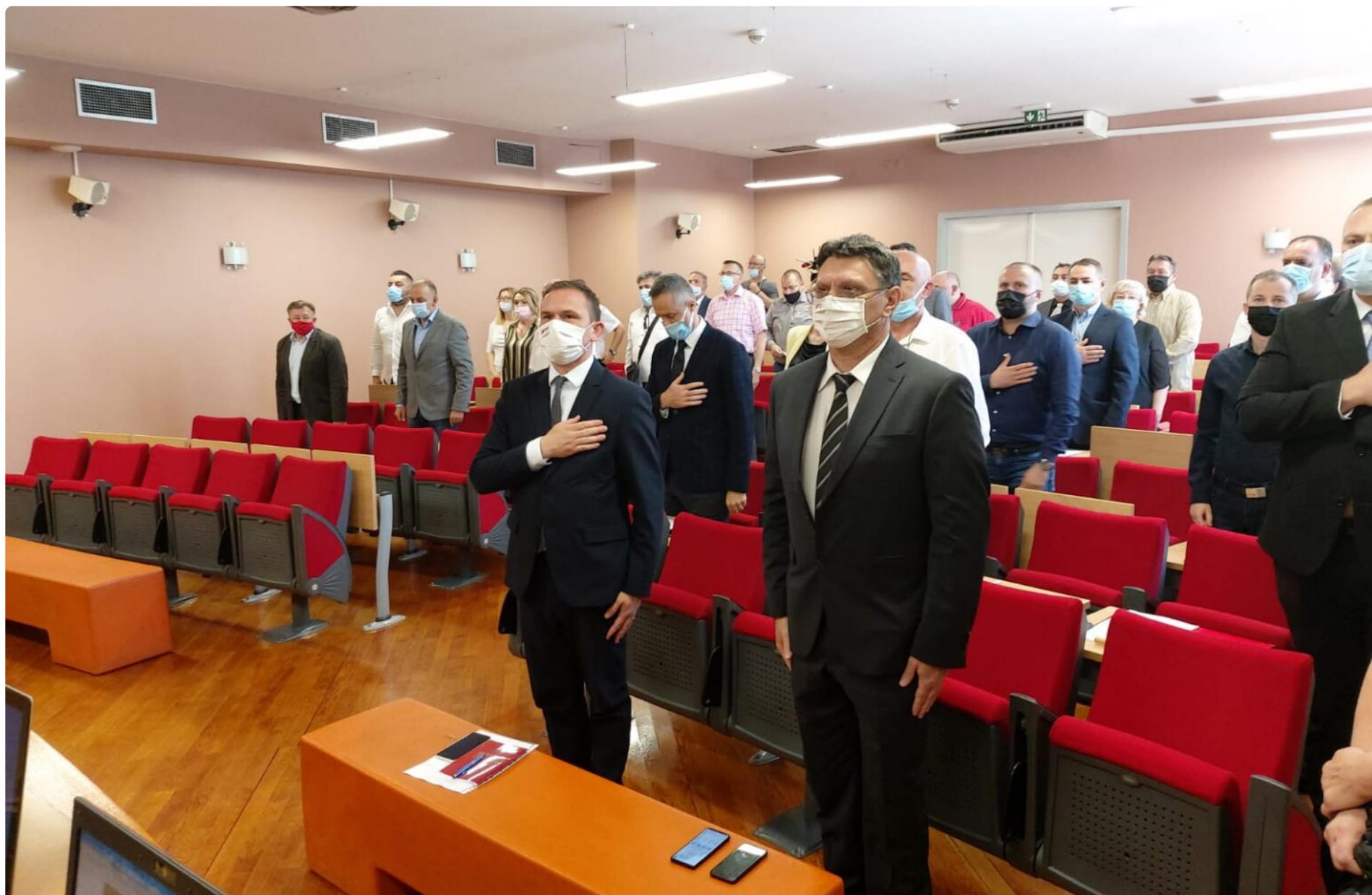
Konstituiranje aktualnog Gradskog vijeća Velike Gorice: Teško je na fotografiji pronaći žene

N ema političara u našoj zemlji koji se neće zaklinjati u ravnopravnost, posebno kada se radi o ravnopravnosti žena i muškaraca. No ta ravnopravnost negdje iščezne između političarskih govora, parola, programa i njihove realizacije. Koliko su žene u politici neravnopravne jasno je već iz letimičnog pregleda popisa članova i članica hrvatske Vlade, Sabora i većine ostalih političkih tijela. Velika Gorica također prati taj hrvatski trend.