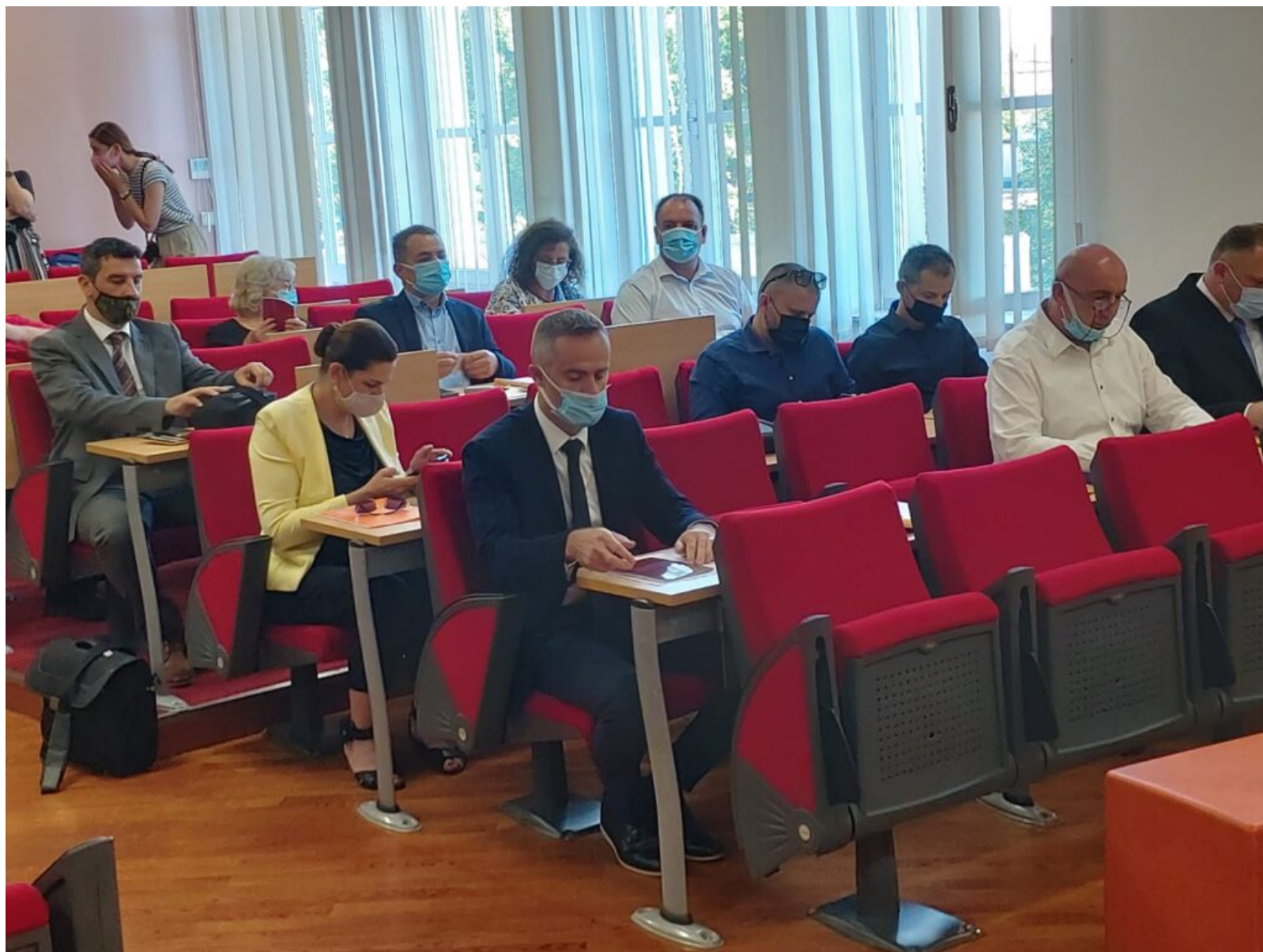
U klupama vladajućih u Gradskom vijeću sjede tri žene

Najviša pozicija na koju se neka žena uspjela probiti je mjesto predsjednice Gradskog vijeća. Samo jedna velikogorička politička stranka na čelnom mjestu ima ženu (GLAS). Velikogorička politička scena očito ženama ne daje previše prilika za uspjeh i napredovanje u stranačkoj hijerarhiji.