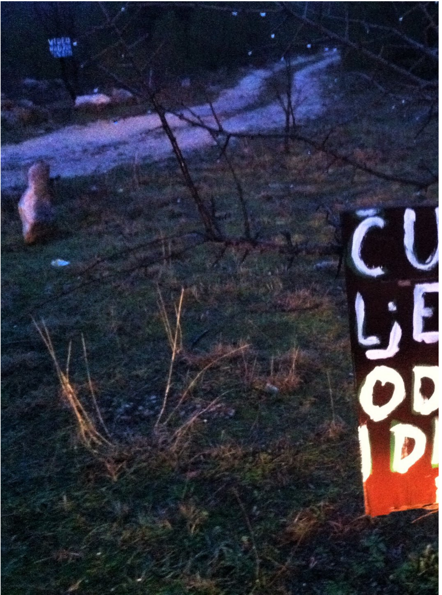
Ilustracija: Prigodni očajnički natpis u Tromilji kod Šibenika

Tako se i usred turistički razvikanih gradova i turističkih naselja, poput Šibenika ili Splita, Vodica, Zadra... i u središtu grada mogu naći prljave površine, a na rubnim dijelovima je ta pojava puno češća. Najčešće su zagađivači čak i oni koji se bave turizmom, a koji nakon preuređenja svojih apartmana razlupani beton, pločice, cigle, wc-školjke i ostalo nehajno odbace u prvi šumarak tek par stotina metara udaljen od njihovog turističkog smještaja . Tolika nesvijest je rijetko videna, budući da isti turisti koje ugošćavaju najčešće s gadenjem ustanove šeući se i čudeći kako je smeća posvuda, te kako takve navike lokalnog stanovništva ne pridonose ugledu turističke destinacije već dugoročno posve degradiraju hrvatski turizam.