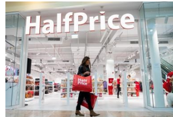
Maloprodajni lanac HalfPrice otvorio prvu trgovinu u Zagrebu