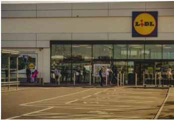
PLAĆE U LIDLU: Koliko zarađuju voditelj prodaje, blagajnik, pripravnik?