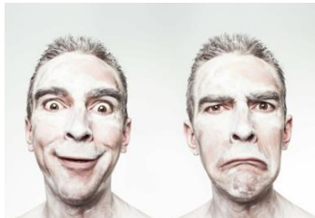
JESTE LI ZNALI: 75% vremena dišemo s jednom nosnicom, 25% s drugom! Evo i zašto!