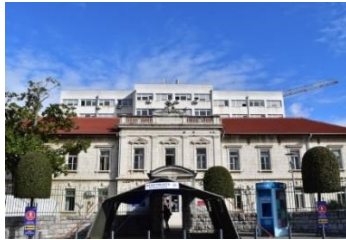
Od posljedica infekcije koronavirusom preminuo 49-godišnjak