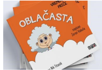
“Oblačasta” druga meteoslikovnica u seriji “Vremenaste priče”