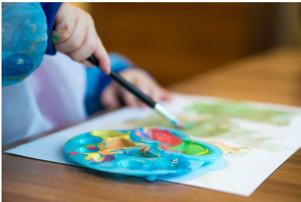
ILUSTRACIJA / IZVOR: PIXABAY.COM

– Na prihvatljiv način se upoznaje djecu s pojedinim teškoćama, provode se aktivnosti zajedništva, aktivnosti koje potiču empatiju i pomaganje. Istraživanja su dokazala da djeca u čijoj je skupini dijete s teškoćama u razvoju ima jače razvijene socio-emocionalne vještine, što znači da su strpljiviji, empatičniji, radije pomažu, imaju pozitivniju sliku o sebi – zaključuje Šipek.