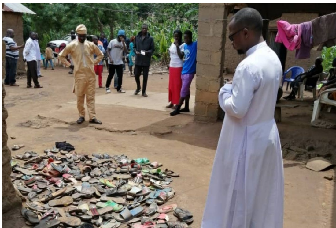
U Nigeriji su česti napadi na kršćane u selima gdje se događaju pokolji i ubojstva

Snaga i jačanje islamske vojske zorno se u izvještaju prikazuje na primjeru zapadnoafričke države Nigerije, gdje nije rijetkost da potpuno naoružane čete islamskih vojnika ulaze u sela i tijekom noći ubijaju ljude, spaljuju kuće, škole i vjerske objekte. To nasilje je vjerski uvjetovano, riječ je o islamizaciji Nigerije, dobro usklađenoj i planiranoj okupaciji, tvrde u Zakladi, a ne kako se često želi prikazati kao sukob između muslimanskih stočara i kršćanskih poljoprivrednika. O tome je detaljnije za Hrvatsku katolički mrežu progovorila i glavna urednica Izvještaja o vjerskoj slobodi zaklade Pomoć Crkvi u nevolji Marcela Szymanski.