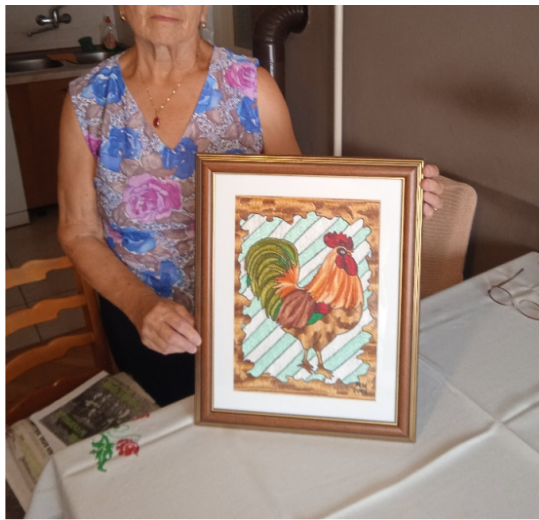
Sliku su izlagane diljem Hrvatske, a ima oko dvije tisuće radova. Da je netko ima toliko raznog materijala i dobrog sponzora, ove brojke bi stvorile milijardera.

K tome treba još dodati, da je Marica izdala 5 knjiga s pjesmama koje je sama pisala.