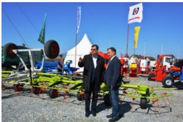
Iz dana prosperiteta i uspjeha

U materijalima za skupštinu se navodi da se društvo u 2021. zadužilo zbog nelikvidnosti kratkoročnim kreditom u iznosu od 426.000,00 kn kojim je zatvorilo postojeći dugoročni kredit. To je zaduženje provedeno bez znanja i suglasnosti suosnivača Grada Bjelovara.