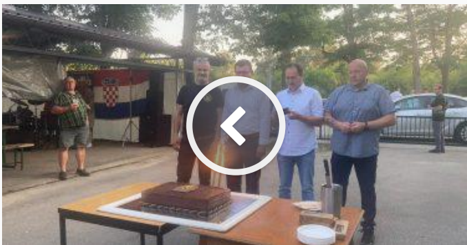
Obilježena trideseta obljetnica SJP Alfa