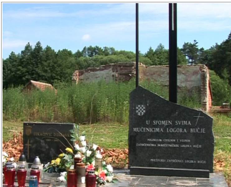
Spomen-obilježje za logoraše iz Bučja - iz filma Časnik mirotvorac