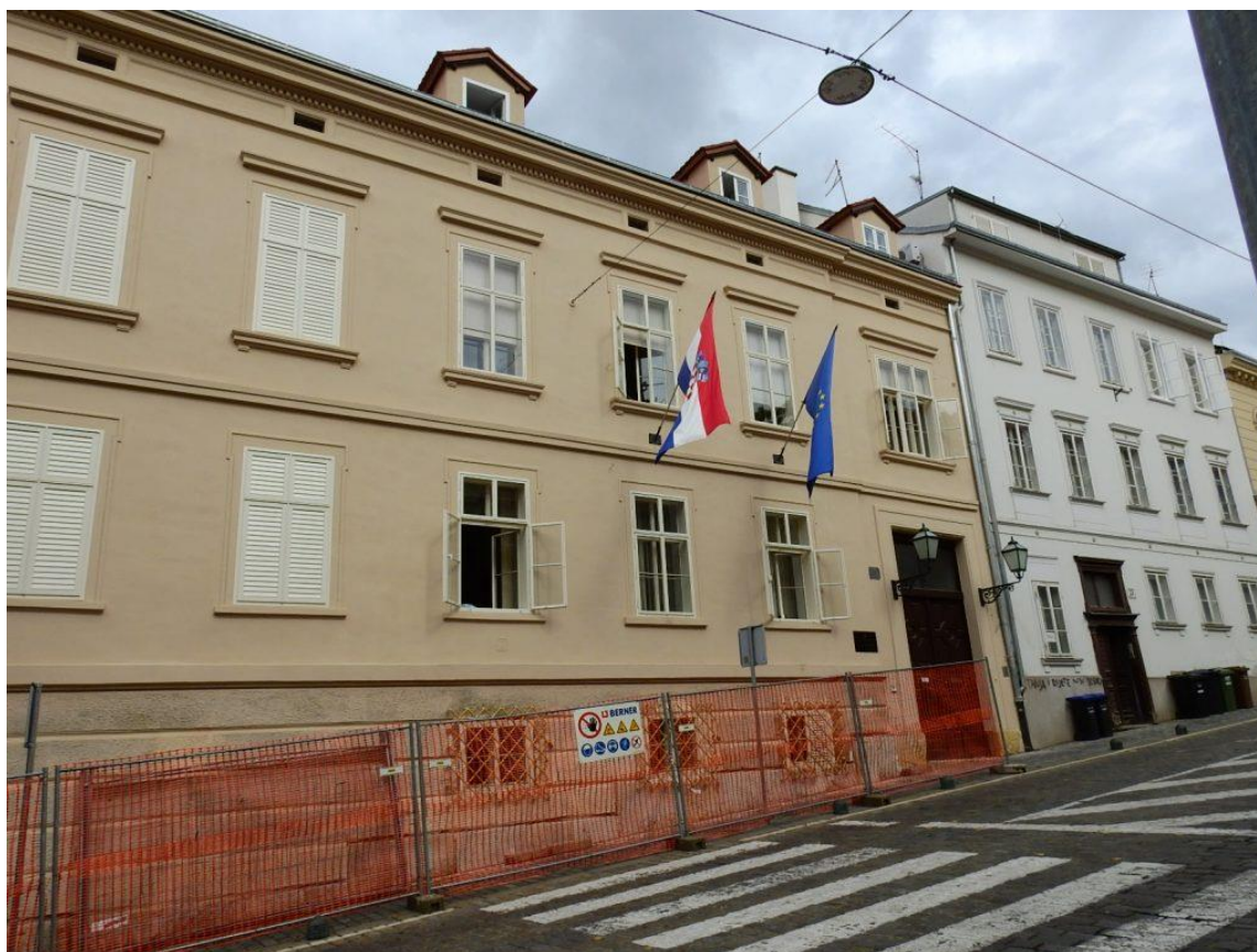
Zgrada u Mesničkoj ulici u Zagrebu gdje je smješten ured Savjeta za nacionalne manjine