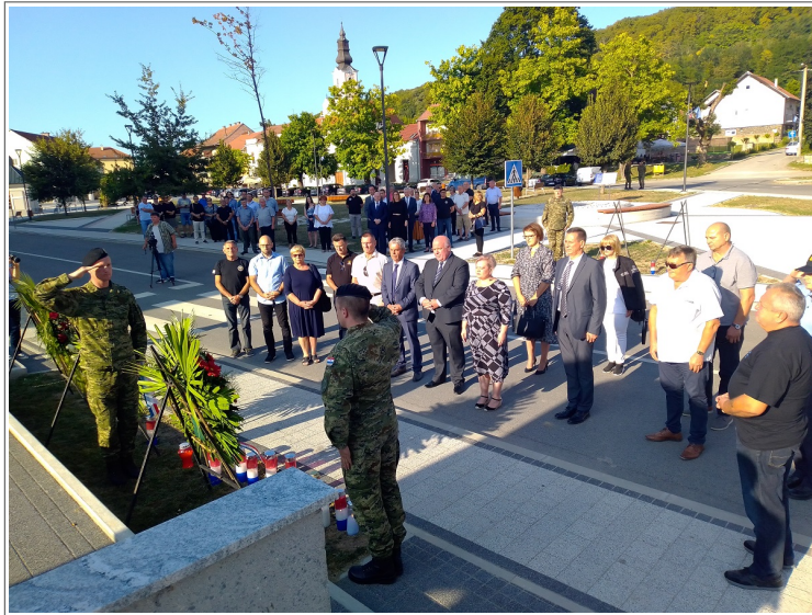
Polaganje vijenaca za sve poginule hrvatske branitelje i civile na Nacionalni dan mirotvorstva 18. kolovoza u Pakracu

Trideset ljeta unatrag, 18. kolovoza bila je nedjelja, ove godine srijeda. U Pakracu je proslavljen Nacionalni dan mirotvorstva, proglašen Odlukom Hrvatskoga sabora na sjednici 29. lipnja 2018. godine, upravo u spomen na dr. Ivana Šretera. Političkom voljom, njegovo ime ispušteno je iz prethodnoga prijedloga Hrvatskoga sabora upućenoga Vladi RH s dodatkom „Dana sjećanja na dr. Ivana Šretera“. Inicijator prijedloga, saborski zastupnik Miro Bulj smatrao je primjerenijim Nacionalni dan mirotvorstva proglasiti 29. kolovoza, kada je dr. Šreter posljednji put viđen živ u zatočeništvu u Branešćima. Ako i nisu istovjetni razlozi prevrtljivih političkih odluka, sam dr. Šreter nikada nije bio pristalica nazivanja institucija po zaslužnim pojedincima. Skroman, ali odlučan, uvijek je gledao širu sliku na dulje staze.