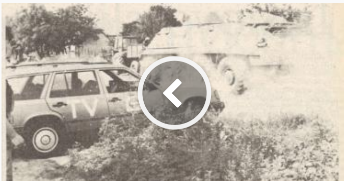
Antiteroristička akcija u osječkom Stadionskom naselju 1991.